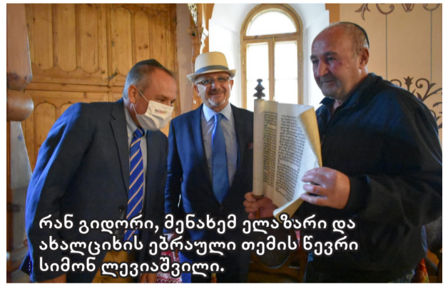
რან გიდორი, მენახემ ელაზარი და ახალციხის ებრაული თემის წევრი სიმონ ლევიასპილი.

ისრაელის ელჩი რან გიდორი სამცხე-ჯავახეთს ეწვია. აქ იგი შეხვდა რეგიონის ხელმძღვანელებს, მოინახულა სხვადასხვა ორგანიზაცია, ეწვია ახალციხის ბეთ ქნესეთს.