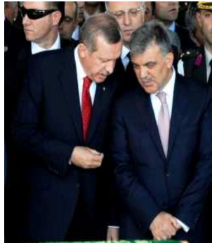
რ. ერდოლანი და ა. გული

ერდოლანის მთავრობის ერთ-ერთი ყველაზე გამორჩეული პროექტი იყო ე. წ. „ქურთული ინიციატივა“, რომელიც მიზნად ისახავდა ქურთული წარმოშობის მოქალაქეების წინაშე არსებული პრობლემების მოგვარებას. ამ მიზნით თურქეთის სახელმწიფო ტელევიზიაში 24 საათიანი მაუწყებლობა დაიწყო ქურთულენოვანმა არხმა, გაიხსნა ქურთული ენის შემსწავლელი კურსები და ფაკულტეტები უმაღლეს სასწავლებლებში; შემუშავდა და განხორციელდა სოციალური და ეკონომიკური ხასიათის პროექტები ქვეყნის სამხრეთ-აღმოსავლეთში მცხოვრებ მოქალაქეებისათვის. თუმცა ამის