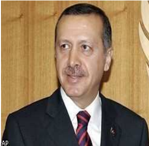
რეჯეფ თაიფ ერდოღანი

ისლამისტების წარუმატებლობას ხელი გარკვეულწილად შეუწყო პოლიტიკიდან ძველი ლიდერის ნ. ერბაქანის ჩამოცილებამაც. აქედან გამომდინარე, პარტია არჩევნებს მოუმზადებელი შეხვდა.