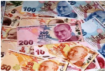
ახალი თურქული ლირა

პრინციპში, თურქეთის ეკონომიკური განვითარების რეცეპტში არაფერია ორიგინალური. ეს სოფლის მეურნეობის განვითარების ჩვეულებრივი კაპიტალისტური სქემაა, რომელიც წარმატებით იქნა აპრობირებული მსოფლიოს