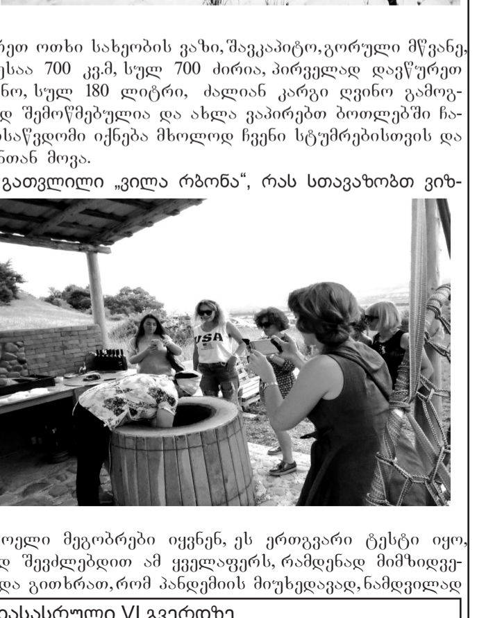
(დასასრული VI გვერდზე)