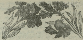
ლ რ ბ ი ლ ი.

ბურები ხელს იძულებული იქნებიან ლელისმიტთან დაბანაკებულა ჯარების ერთი ნაწილი ორანჟეში გაგზავნონ და მთი თავისი ძალაც შესუსტონ. უოკელ შემთხვევაში ამის კრიტიკული მომენტო ხელა—და ვინც აქედან გამარჯვებულა გამოვა, ბრძოლისაჩრხვ იმის სისარტებლთ ატრიალდება.