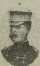
ბ. ვაჟა-ფშაველას განზ. ფ.