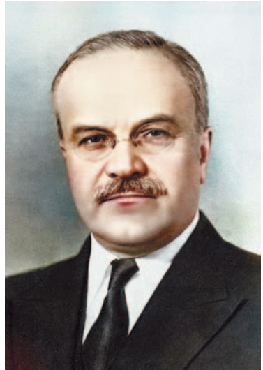
სამხედრო ბლოკების ფორმირება უძღვოდა წინ ორივე მსოფლიო ომს.

ნატოში შესვლის შესახებ განაცხადის შეტანისას ახალი საბჭოთა მთავრობა იმედოვნებდა, რომ საერთაშორისო მდგომარეობა სტალინის გარდაცვალების შემდეგ შერბილდებოდა. თუმცა თავად ბელადი ცდილობდა, ეჩვენებინა, რომ თუ ნამდვილად არ უნდოდა დასავლეთთან დამეგობრება, როგორც მინიმუმ, ამის სურვილი მაინც გა-