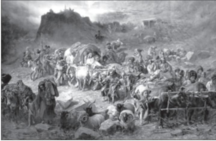
ვატრა ნიკოლოზის კი ბრუზინსკი — „მთიელაზი აულს ტოვებან“

შჩედროვის პოლკი საქართველოში 1801 წელს ჩამოვიდა იმ 6 ათასი კაცის შემადგენლობით, რომლებიც პავლე I-ისა და გიორგი XII-ის მოლაპარაკებაში იყო მოხსენიებული. მათი საქართველოში ჩამოსვლა ზუსტად რომ სულზე მისწრება იყო და ქვეყანაში სტაბილურობის წინაპირობას წარმოადგენდა. ტუჩკოვის პოლკი, რომელსაც 2 ქვემეხი ჰქონდა, გორში, სურამსა და ცხინვალში განლაგდა. რუსების მიერ ამ ადგილების დაკავებამ აიძულა იმერეთის მეფე სოლომონი, გაემზა თავისი ლაშქარი, რომელიც იმ ქორზე დაყრდნობით შეაგროვა, რომ რუსები საქართველოს ტოვებენო. გაქცეულ უფლისწულთა მიერ წაქეზებული მეფე ფიქრობდა ქართლში შეჭრას, მაგრამ უფლისწულთა განზრახვა განუხორციელებელი დარჩა. მათ იმედები თავიანთი გეგმების რეალიზაციის თაობაზე უფრო მე-