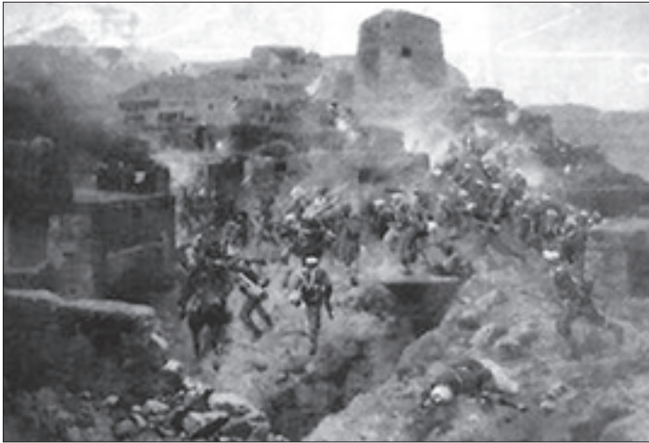
რუსი ჯარისკაცების შეტაკება ჩრდილოკავკასიელ მოთარეშებებთან

ქართულ მიწა-წყალზე ჩამოსახლებული ჩრდილოკავკასიელების მიერ შექმნილი პუნქტები საიმედო დასაყრდენი გახდა დალესტნის სოცია-