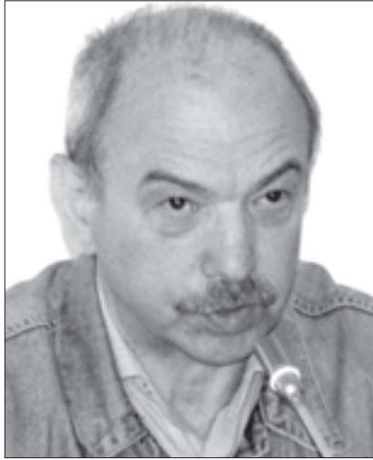
„ოცდწამწამი“ მემორიული კომპლექსი

გუნდში არ არსებობდა ისეთი ადამიანი, რომელსაც შეეძლო მისი ახირებებისა და სრულიად უაზრო, კონტრპროდუქტიული, მაგნე მოქმედებების შეკავება. ვინც დაიწყო მის გვერდით, ცდილობდნენ, გამოეცნოთ, რა ესიამოვნებოდა ამ ადამიანს და შესაბამისად მოქცეულიყვნენ, რათა არ გარიყულიყვნენ და პასუხი არ ეგოთ სულ სხვა მეთოდებით, როგორც იტყვიან. იყვნენ ისეთებიც, რომლებიც იქეთ აქეზებდნენ სააკაშვილს, თუ რამეს იტყოდა ასეთ ახირებულს და რადიკალურს. მის გვერდით... ასეთ ვითარებაში რაციონალური აზრის ძიება იყო შეუძლებელი.