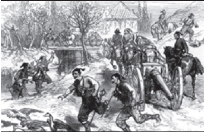
ოსმალოები კარცვავენ სოფელს

ზღვის ფლოტის ხმელთაშუა ზღვის ექსპედიციის პერიოდში).