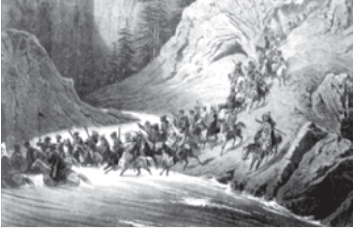
ღარბაჯის მიხედვით ჩერქეზები მთიანიდან ეშვებოდნენ

რადღების ღირსი იყო მოვლენა, რომელმაც კარდინალურად შეცვალა სიტუაცია კავკასიის ხაზზე და საქართველოში. იმპერატორ ალექსანდრე პირველამდე მიდიოდა ხმები ამიერკავკასიის მხარისა და კავკასიის ხაზის მოუნესრიგებელი მმართველობის თაობაზე, არადა, მთავარი ახლა იყო საქართველო. კოვალენსკის უტაქტობამ და ანგარებიანობამ საბოლოოდ განარისხა ქართველები, რომლებმაც კვლავ უფლისწულებს დაუჭირეს მხარი. უკეთესად არც კ. ფ. კნორინგი იქცეოდა. ამიტომ 1802 წლის 8 სექტემბერს მეფის ბრძანებით კნორინგიცა და კოვალენსკიც უკან გაითხოვეს, ხოლო მთავარსარდლად საქართველოში გენერალ-ლეიტენანტი პავლე დიმიტრის ძე ციციანოვი დაინიშნა. მან მთლიანად შეცვალა მთიელებთან ბრძოლის ტაქტიკა. თუ კნო-