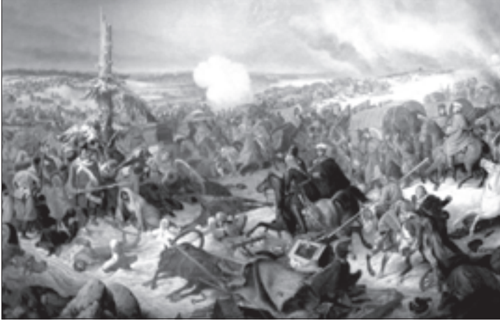
ერთ-ერთი ბრძოლის ეპიზოდი

სათის, რაც ხელს შეუშლიდა ლეკებს, საქართველოში შეჭრილიყვნენ. ამ ღონისძიებით შესაძლებლად მიაჩნდათ, მოეჭრათ პირდაპირი გზა ახალციხისაკენ და ეიძულებინათ ლეკები, შემოევლოთ ყარაგაჩიდან.