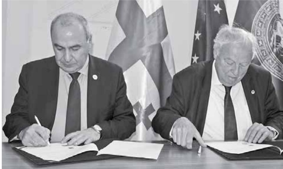
მემორანდუმის ხელმოწერის ცერემონია

24 აპრილს თბილისის სახელმწიფო უნივერსიტეტში მნიშვნელოვანი სამეცნიერო ჰაბი — ევროპის აკადემიის (Academia Europea) თბილისის რეგიონული ცენტრი გაიხსნა. ლონდონის ფარგლებში, ევროპის აკადემიის თბილისის რეგიონული ცენტრის დაფუძნების თაობაზე თბილისის სახელმწიფო უნივერსიტეტსა და ევროპის აკადემიას შორის ურთიერთთანამშრომლობის მემორანდუმს მოეწერა ხელი. ნორვეგიის, პრიტანეთის, ესპანეთისა და პოლონეთის შიდა საპარტნიორო არის მხარეთა ქვეყანა, სადაც ეს ცენტრი გაიხსნა. მთავარი და გამორჩეული ნიშნა, რომელიც თბილისის ცენტრმა დაიკავა, არის ბიოკულტურული მრავალფეროვნების კვლევა, რომელიც ჩვენს რეგიონს შეუძლია განსაკუთრებული სიღრმე და მსოფლიო მნიშვნელობა.