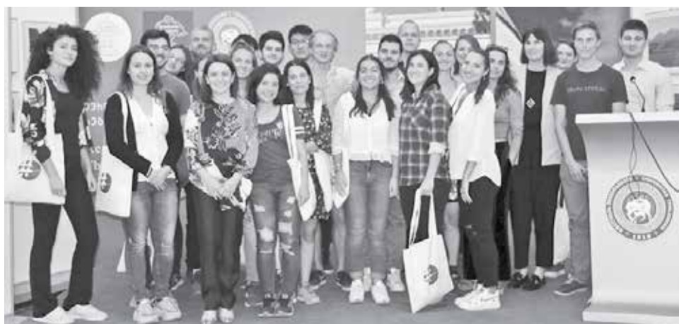
თსუ-ის საერთაშორისო ურთიერთობათა დეპარტამენტის ორგანიზებით გამართული შეხვედრა უცხოელ სტუდენტებთან

ველყოფს უნივერსიტეტში მიმდინარე პროცესების, სწავლისა და სწავლების, სამეცნიერო კვლევების, უმაღლესი განათლების სტიმულირებას და საზოგადოების ინფორმირებას უნივერსიტეტში (და ზოგადად, უმაღლესი განათლების სფეროში) მიმდინარე ამბების შესახებ მიზნად არ ისახავს მოგების მიღებას“.