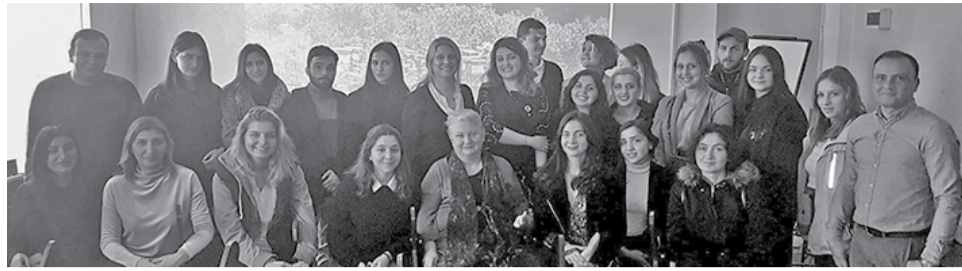
აგროკომუნიკაციისა და სოფლის მეურნეობის თემატიკის გაშუქებით დაინტერესებული ყველა პირისთვისაა შექმნილი.

ტ სუ-ში 2019 წლის გაზაფხულის სემესტრიდან ახალი სალექციო კურსი „აგროსაკითხების გაშუქება“ დაიწყო. სტუდენტები სპეციალურად აგროსაკითხებით დაინტერესებული პირებისთვის შექმნილი წიგნით იხელმძღვანელებენ და კურსის ფარგლებში შეძლებენ აგრობიზნესის სექტორში გაერთიანებული სხვადასხვა თემატიკის შესწავლას და ამ თემების პროფესიონალურ დონეზე გაშუქებას.