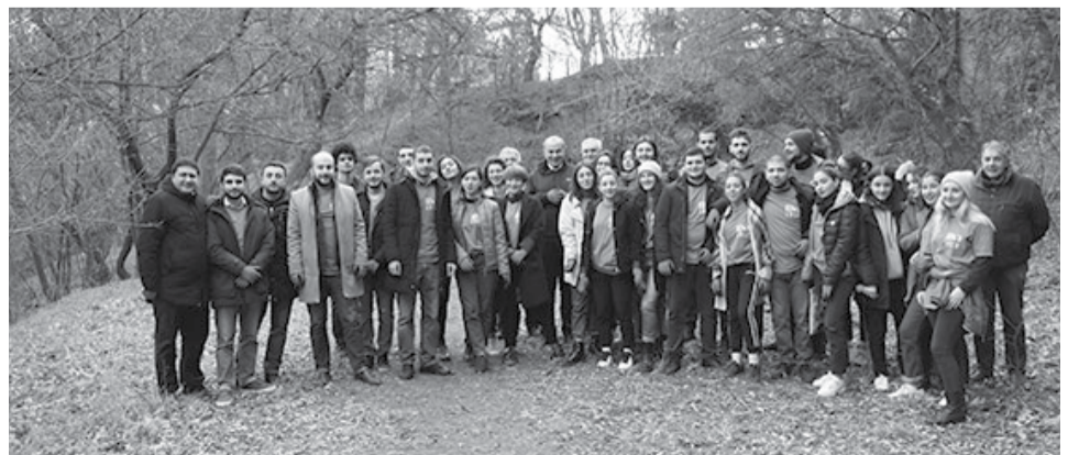
ჩანართი მომზადებულია საზოგადოებასთან ურთიერთობის დეპარტამენტის მიერ მოწოდებული მასალებით

თსუ-ის სტუდენტების მიერ ინიცირებული დასუფთავების აქცია თსუ-ის ადმინისტრაციის, ეკოლოგიური უსაფრთხოების ფონდისა და ქალაქ თბილისის მერიის მხარდაჭერით მოეწყო.