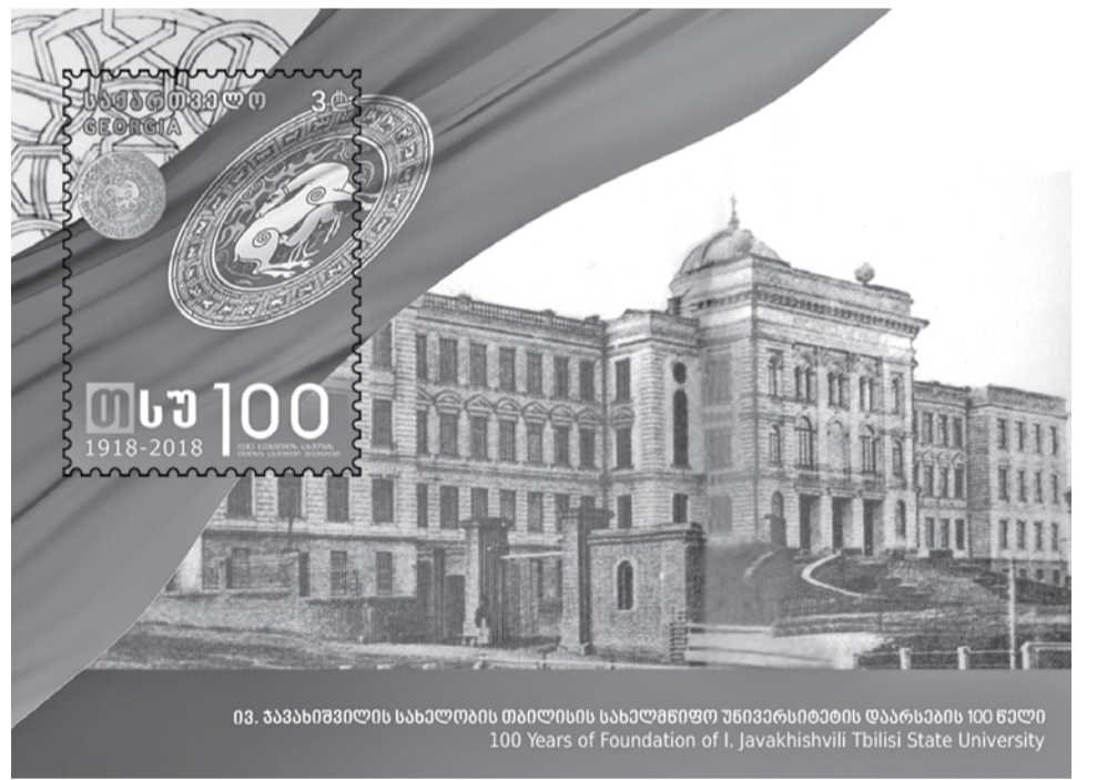
03. ჯავახიშვილის სახელობის თბილისის სახელმწიფო უნივერსიტეტის დაარსების 100 წელიწადი 100 Years of Foundation of I. Javakishvili Tbilisi State University

ვერსიტეტის განვითარებაზე ზრუნვას, აერთიანებს თბილისის სახელმწიფო უნივერსიტეტის კურსდამთავრებულებსა და მის მხარდამჭერებს.