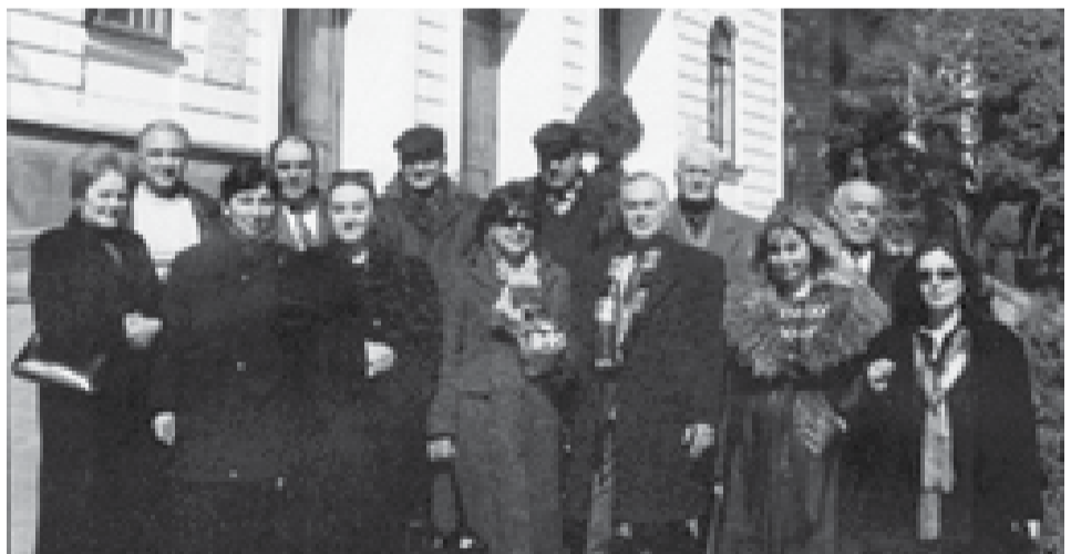
საქართველოს გეოგრაფიის კათედრის თანამშრომლები, 2003 წელი

განვიღო 20 წლის მანძილზე კათედრის თანამშრომლების მიერ დაცულია 5 დისერტაცია. 2002-2017 წლებში კათედრის ძალისხმევით გამოიცემოდა სამეცნიერო ჟურნალი „საქართველოს გეოგრაფია“, სადაც სტატიები იბეჭდებოდა ქართულ, რუსულ და ინგლისურ ენებზე. 2018 წლიდან ჟურნალი ინტეგრირდა საუნივერსიტეტო ინტერდისციპლინურ გამო-