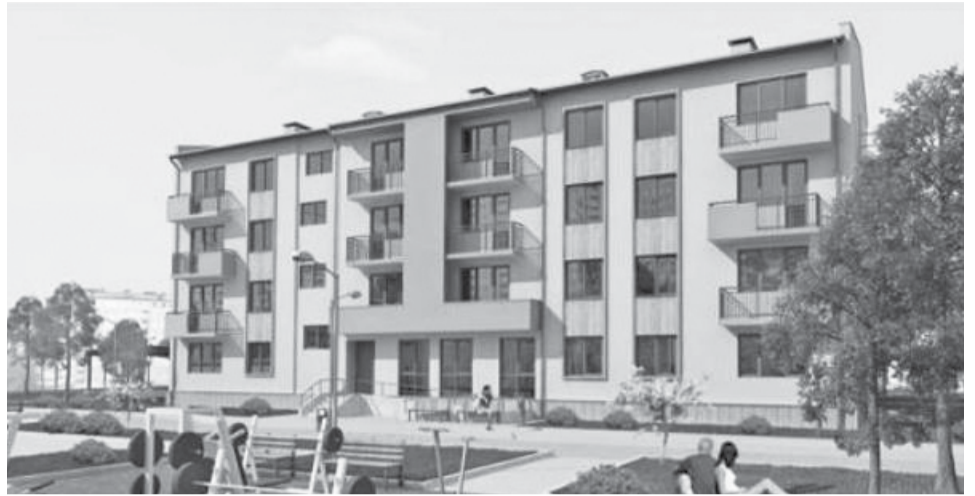
ახალი საერთო საცხოვრებელი ლისზე

ნიშნავია ერაზმუს პლუსის პროგრამის ფარგლებში თანამშრომლობა და ა.შ. თბილისის სახელმწიფო უნივერსიტეტში 64 პროექტი ხორციელდება, რაც შანსს აძლევს ჩვენს სტუდენტებს – მონაწილეობა მიიღონ გაცვლით პროგრამებში და თავისი უნარები და თავისი ცოდნა გაიღრმავონ ჩვენს პარტნიორ ევროპულ უნივერსიტეტებთან ურთიერთობაში. მნიშვნელოვანია პროფესორების გაცვლით პროგრამებში მონაწილეობაც, რასაც, წელს, ადმინისტრაციის წარმომადგენელთა გაცვლითი პროგრამებიც დაემატება.