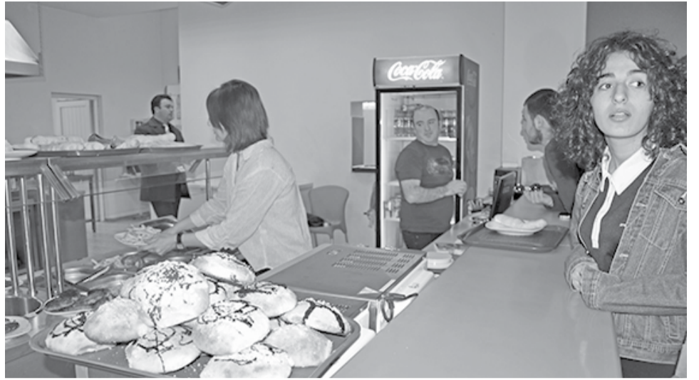
კვების ობიექტი თსუ-ში

– უნივერსიტეტის მეორე კორპუსის თემა – ეს არის, ალბათ, ყველაზე მთავარი თემა ჩვენი წლებიდან დასრულებული გეგმისა. სულ მალე დაიწყება მეორე კორპუსის სრული რეკონსტრუქცია-რეაბილიტაცია და, შესაბამისად, სასწავლო და სამეცნიერო გარემოს გაუმჯობესება. თუმცა, მხოლოდ მეორე კორპუსის სრული რეაბილიტაციით არ შემოიფარგლება ჩვენი გეგმები: უკვე დაიწყეთ მოწესრიგება მალღივი კორპუსისა, სადაც გამოიკვალა ყველა ფანჯარა; ასევე დაიწყეთ მოწესრიგება ბიოლოგიის კორპუსისა... იქ ახალი სასწავლო წლისათვის ბევრი აუდიტორია მომზადდა, გარემონტდა ლაბორატორიები, სახურავი და ა.შ. მართალია, მთლიანად ვერ შევძელით