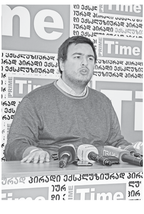
ამ ეტაპზე შინაგან საქმეთა სამინისტროს თბილისის სახელმწიფო უნივერსიტეტიდან დოკუმენტაცია არ გამოუთხოვია

„ბოლო პერიოდში „აუდიტორია 115“-ს ბრძოლა რამდენიმე მიმართულებით წამოიწყო: ჩვენ დავუპირისპირდით განათლების მინისტრს და მის პოლიტიკას უნივერსიტეტში; დავუპირისპირდით საქართველოს საბანკო სექტორს, რომელიც უამრავ მუშას ათავისუფლებს რუსთაველი თუ სხვა ადგილებში; დავუპირისპირდით კომპანიას, რომელიც მაინცდამაინც კარგ და სახარბიელო სამუშაო გარემოს არ უქმნის სტუდენტებს (წიგნების მაღაზიას ვგულისხმობ). ეს სამივე რგოფი – ბანკები, მედიამონოპოლისტები, მინისტრები შეშფოთებულნი არიან ჩვენი ბრძოლით, ამის შედეგია ასეთი აბსურდული ბრალდებები და შურისძიება. „კვირის პალიტრას“ ორი დავა მოვუგეთ ეთიკის ქართლის საბჭოში. ორივე შემთხვევაში ეთიკის საბჭომ თქვა, რომ „კვირის პალიტრა“ დაარღვია ეთიკის ნორმები. ამის შემდეგ, რატომღაც, პროკურატურა თავად მივიდა კვირის პალიტრაში და დაიწყო ძიება. ფაქტია, რის გამოც გვებრძვიან! მეთოდები სასაცილო და სამარცხვინოა,“ – განაცხადა „აუდი-