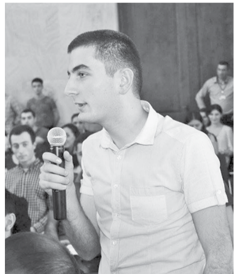
მოამზადა თამარ ღაღინაძე

კოდექსის ამოქმედება დაგეგმილია 2016 წლის 1 იანვრიდან. ამასთან, იმ მუხლების ამოქმედება, რომელთა იმპლემენტაციისთვის დამატებითი ღონისძიებების გატარებაა საჭირო, იგეგმება 2016 წლის განმავლობაში და 2017 წლის 1 იანვრიდან.