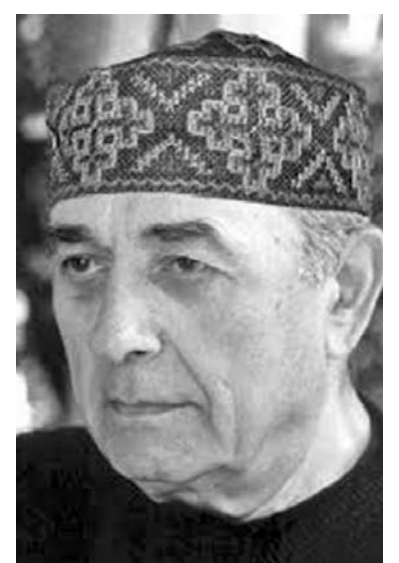
P.S. მასლუსს, ჩემი უფროსი დაიკო მთელი საღამო მენჩინენ-ბოდა: ხვალ ორიანს გპერტყავს ნადა მასწავლებელი, გაკვეთილი არ იციო! სინამდვილეში, ხუთიანს დავიმსახურე და, როცა თალიკოს „ავახარე“, წავუმატე: რაო, არ მნაცოდნარა! შეიდათუელზე მეტი წლის წინანდელი ამბავია, მარა, გუმინდელივით მასლუსს, არ შეუცხადება „მნაცოდნარა“.

ვით: ხომ ყველასათვის გასაგებია სიტყვა, „ნაყვარება“! გასაგებია, ლიტერატურული ფორმაა, „ყვარება“, მაგრამ ისიც ხომ უდავოა, რომ, „ნაყვარება“ უფრო ზუსტად, უფრო მკაფიოდ, მსუბუქი ირონიითა და, ამდენად, მეტი იუმორით გამოხატავს ავტორის დამოკიდებულებას კარგად ვიცი, ღირსების მქონე ადამიანი რომ იაფფასიან სენსაციებს უნდა ერიდოს და ამას არც ვაპირებ; თანაც, შესაძლოა, ეს საკითხი ენათმეცნიერთათვის სულაც არ იყოს, ახალი ამერიკა! მაგრამ, რადგან თქვენი მონა მორჩილი არ გახლავთ პროფესიონალი ლინგვისტი, დილექტანტურ დონეზე ვკითხულობ: რა ეწოდება ხალხურ მეტყველებაში ხშირად ხმარებულ ასეთ სიტყვებს, მიმღებობა? თურმეობითა? თუ რა? Dდა ერთიც: რაგინდ ორჭოფულადაც უნდა მოგეჩვენოთ დასმული კითხვა, პასუხიც ორჭოფული არანაირად არ ეგების!