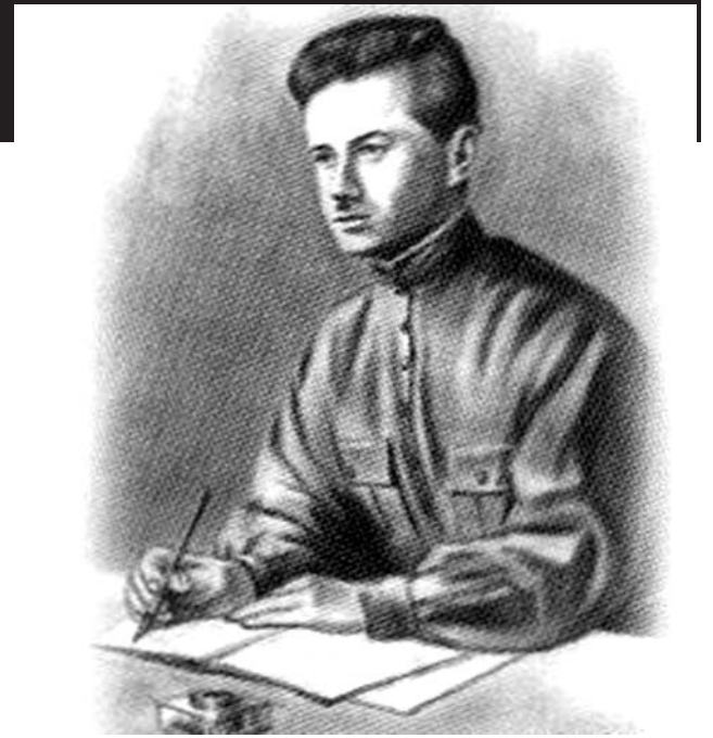
იპა კოლონია 1903 - 1928