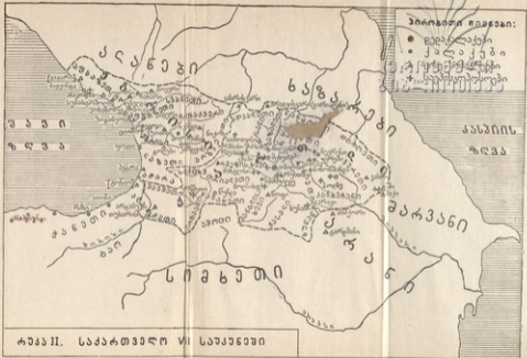
რუკა II. საქართველოს VI საეკონომიკური რეგიონები