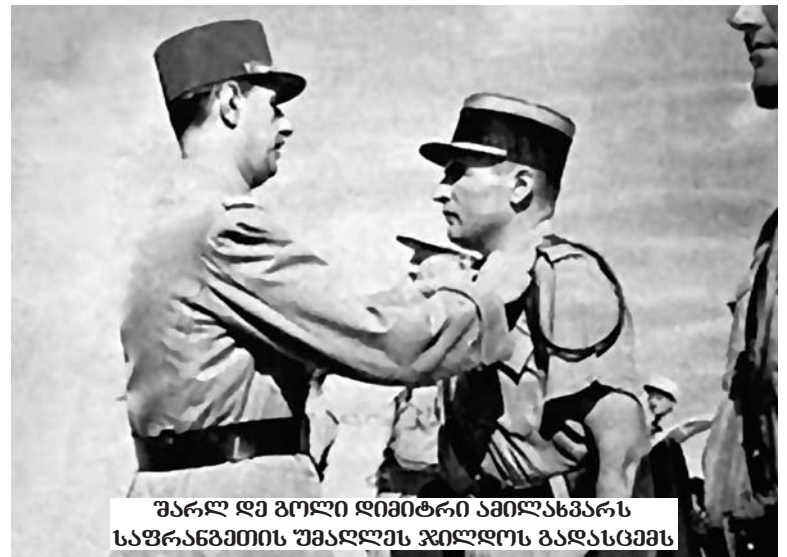
შარლ დე გოლი დიმიტრი ამილახვარს საფრანგეთის უმაღლეს ჯილდოს გადასცემს

გან, რომელიც ითვლება ევროპული დემოკრატიის და ფასეულობების აკნად და ასევე დემოკრატიის ერთ-ერთ მთავარ ლოკომოტივად დღევანდელ მსოფლიოში. შეგახსენებთ კიდევ ერთ ისტორიულ ფაქტს: ორმოცდაათიან წლებში საფრანგეთის პრეზიდენტის შარლ დე გოლის ბრძანებით, უმაღლესი სამხედრო მიღწევებისა და მხედ-