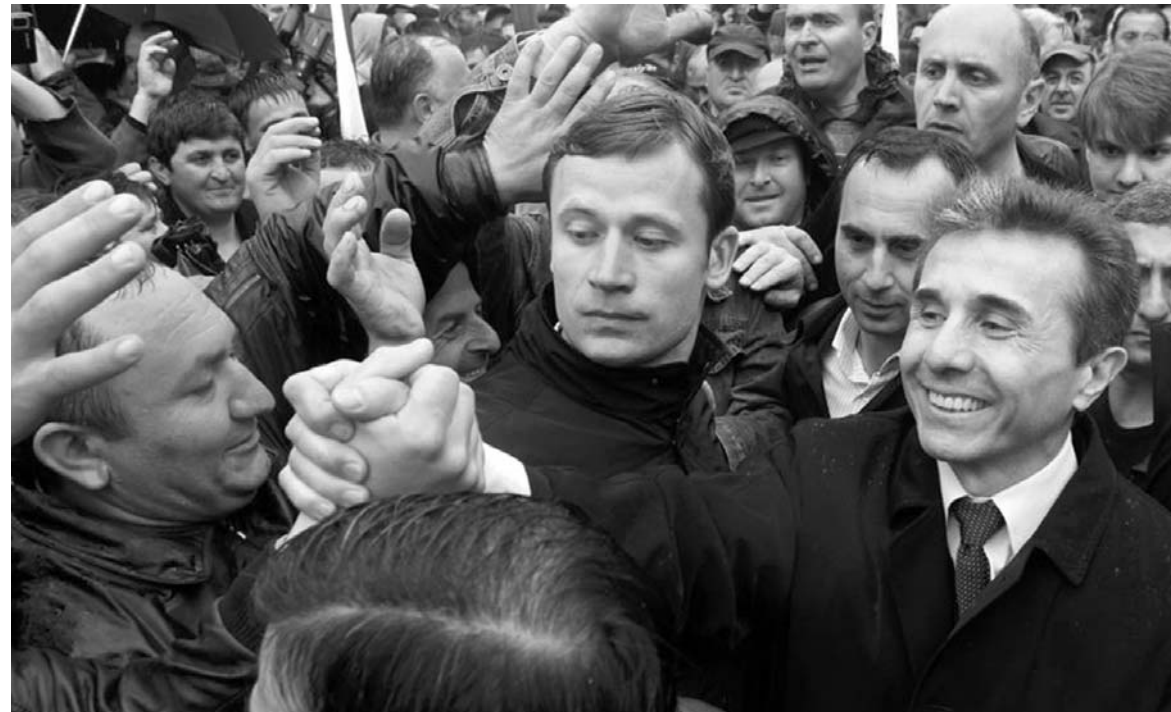
დაახ, ყველამ ვიცით, შემდეგ

გესმით? ბიძინა ივანიშვილი ყოფილა კანონიერი ქურდი და კვლავ რჩება კანონიერ ქურდად. ამან, ამ გათახსირებულმა ხუხაშვილმა უარი არ თქვა "კანონიერი ქურდის" საჩუქარზე, ცოლის გა-