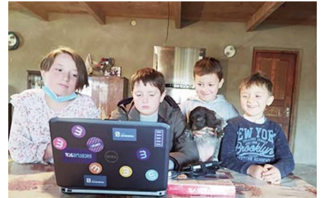
საერთო ჯამში, პანდემიის პერიოდის განათლებამ მართლა ბევრი პრობლემა წარმოშვა – სოციალური უნარები დაიკარგა, ვერ ვახერხებთ ჯგუფურ და წყვილებში მუშაობას.

პანდემიის დაწყებისას, ბუნებრივია, არც მე და არც არავინ ამისთვის მზად არ იყო, რეალურად დროც არ გვექონდა მომზადებისთვის, ამიტომ უამრავი ადამიანი შევანუხე, რომ სწავლის მიღმა დარჩენილი მოსწავლეებისთვის თანხა შემეგროვებინა ინტერნეტპლატფორმის შესაძენად. შევანუხე სხვადასხვა ორგანიზაციები, კავკასიის საერთაშორისო უნივერსიტეტი, ასოციაცია „ქართველები საფრანგეთში“ და სხვები... მათ ვუგზავნიდი მოსწავლეების ტელეფონის ნომრებს და კეთილი ადამიანები ინტერნეტის საფასურს ურიცხავდნენ – 19 ლარს. მეორე ტალღის დროს, ბუნებრივია, ვეღარ ვთხოვდი, რომ ისევ ჩაერიცხათ თანხა, უნივერსიტეტსაც ხომ თავისი პრობლემები