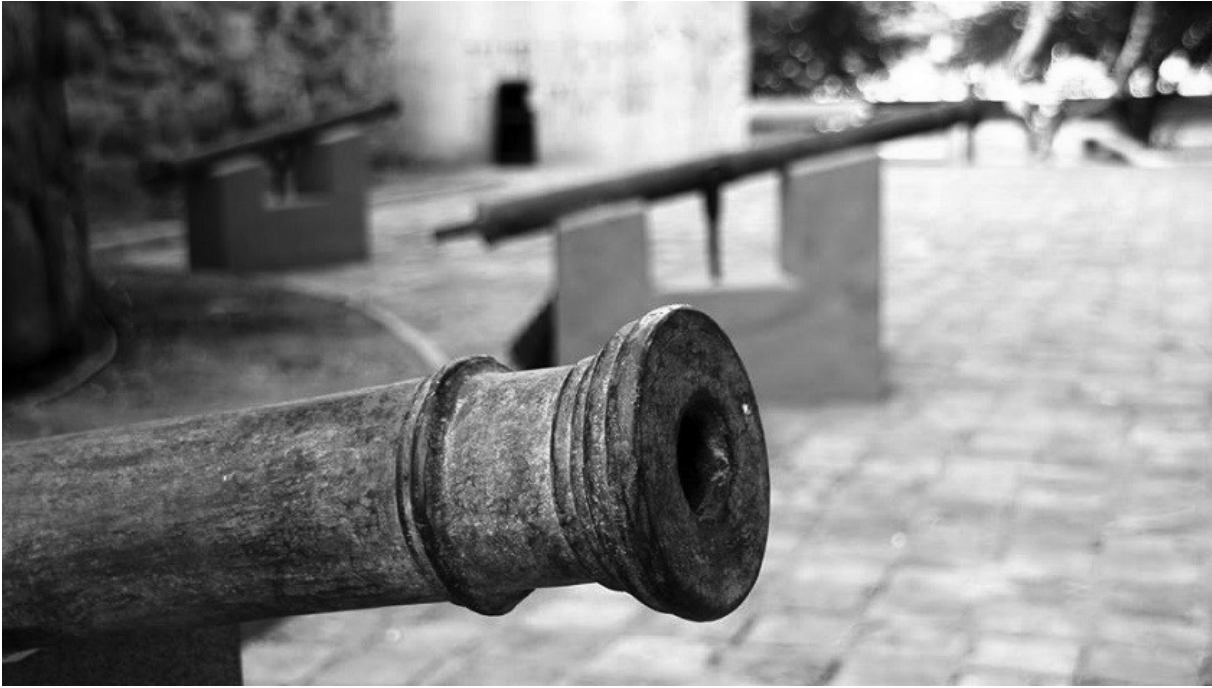
მეფე ერეკლეს ინიციატივით აგებულ საარტილერიო ქარხანაში (ჯაბახანა) ჩამოსხმული ზარბაზნები.

ძირითადი ძალების გახლეჩა-დანანევრება. ერეკლე II-ის ტაქტიკურმა ხრიკმა მონინალმდეგის საბრძოლო წყობაში გამოიწვია პანიკა, მართვის მოშლა და დემორალიზებული ძირითადი ძალების არაორგანიზებულად უკან დახევა. ბრძოლის შემდეგ ეტაპზე განხორციელებულმა დევნამ მონინალმდეგეს არ მისცა ძალების კონცენტრაციის საშუალება, რამაც შეაპირობა მისი საბოლოო განადგურება.