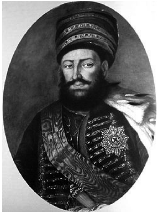
ნეფის ერეკლის სიკვდილი, დაქცევა ხმელეთისაო“

„ღმერთო, რა დიდი ბრალია, არევა ქალაქისაო,