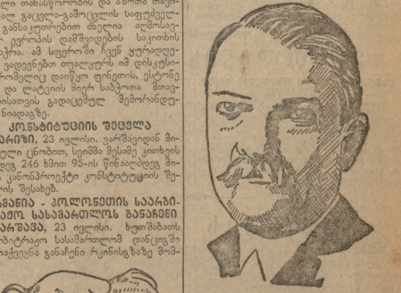
საქართველოს კომუნისტური პარტიის ცენტრალური კომიტეტის წევრი...

საქართველოს კომუნისტური პარტია ცენტრალური კომიტეტი