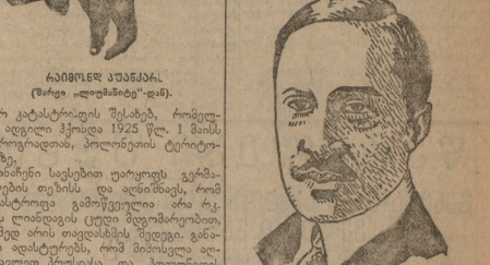
საქართველოს კომუნისტური პარტიის ცენტრალური კომიტეტის წევრი...

საქართველოს კომუნისტური პარტია ცენტრალური კომიტეტი