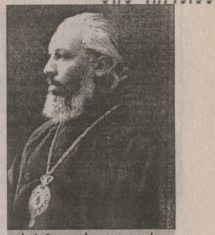
საქართველოს კათოლიკოს-პატრიარქი კაიხოსრო II.