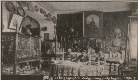
ქმსკ საზოგადოების ბიბლიოთეკა-მუზეუმი. 1904 წ.

საქართველოს პარლამენტის ილ. ქაჭავაძის სახელობის ეროვნული ბიბლიოთეკის გენერალური დირექტორი.