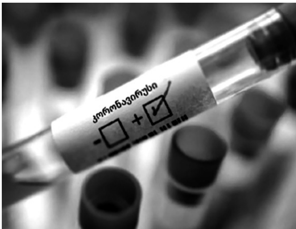
P.S. ბატონ დავითთან საუბარი ჩაწერილი იყო 2 ნოემბერს. სამწუხაროდ, გუშინ, მისივე ინფორმაციით, დაინფიცირებულთა რიცხვი კიდევ 20-ით გაიზარდა.

აუცილებლად ატარეთ პირბადე, დაიცავით დისტანცია და მოერიდეთ თავშეყრის ადგილებს, აღნიშნა საუბრის დასასრულს დავით ჩიქოვანმა.