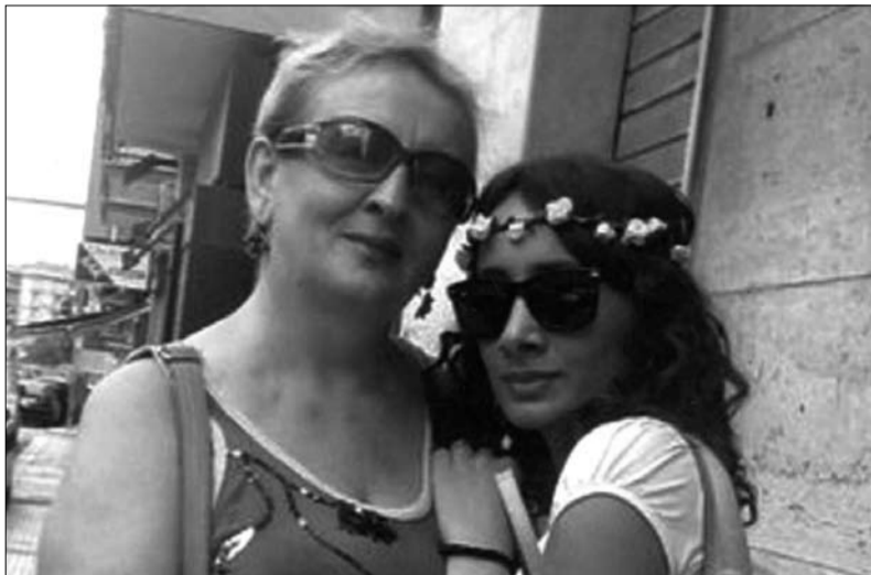
ანა და მისი დედა

„გამარჯობა დედა!“ ყველაფრის დამტყვევებს ორი სიტყვა ნოდარ ღაღაბის რომანიდანაა — „მზინი დამე“. 8 წლის ბიჭს დედა გვერდიდან ააცალეს, ცრემლსა და ტკივილში დატოვეს და წლების შემდეგ უკან დაბრუნებულ მშობელს, შეიშა დედა ვეღარ დაუბახა.