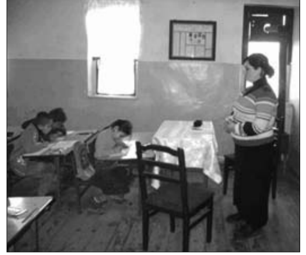
ლონ სამოქალაქო განათლების დონე და ჩაერთონ სამოქალაქო აქტივობებში. შეხვედრას ესწრებოდა რამდენიმე მასწავლებელი, ადგილობრივი მოსახლეობა და ახალგაზრდები.

ეს ხელს უშლის მათ განვითარებას და ვერ ახერხებენ ინტეგრაციას. შეხვედრა გაიმართა იანეთის საჯარო სკოლაში. სკოლაში პირველიდან მეცხრე კლასის ჩათვლით არის სწავლება და სულ 27 მოსწავლეა. მოსწავლეები აქტიურად არიან ჩართული კულტურულ და სპორტულ ღონისძიებებში. ცოტა ხნის წინ მათ სპორტულ დარბაზს და რამდენიმე საკლასო ოთახს ჩაუტარდა სარემონტო სამუშაოები, თუმცა ჯერ ისევ პრობლემად რჩება გათბობა და სხვა საკლასო ოთახების კეთილდღეობა. გარდა ამისა, ახალგაზრდებს არ ეძლევათ საშუალება, აიმაღ-