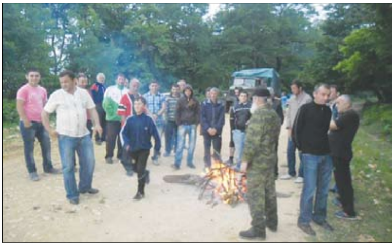
ერთად - ძვირ ზალსარჩენად

კვევით აყალიბებდა მოთხოვნებს, მათ შორის პირველი ასეთი იყო: უპირობოდ შეწყდეს ბარბაროსული ჭრა! სვერის ტერიტორიული ორგანოს რწმუნებულები თითებს იშველიებდა პრობლემების ჩამოთვლისას, რომლებიც წარმოშვა დასაქმების ყოფილი მინისტრის პაატა ტრაპაიძის კომპანიამ ორი წლის განმავლობაში ტყეების უმოწყალო ჩეხვით.