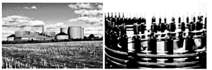
მინიშუმ 60 ახალი საწარმო

I კომპონენტში ჩვენი პარტნიორი საფინანსო ინსტიტუტებია: ვითიბი • კონსტანტა • კრედიტ • კრისტალი • ლიბერთი ბანკი