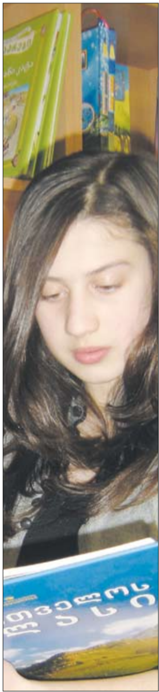
მისამართი: ქუთაისი, „პოპული“; ტელ.: (790) 927 927.