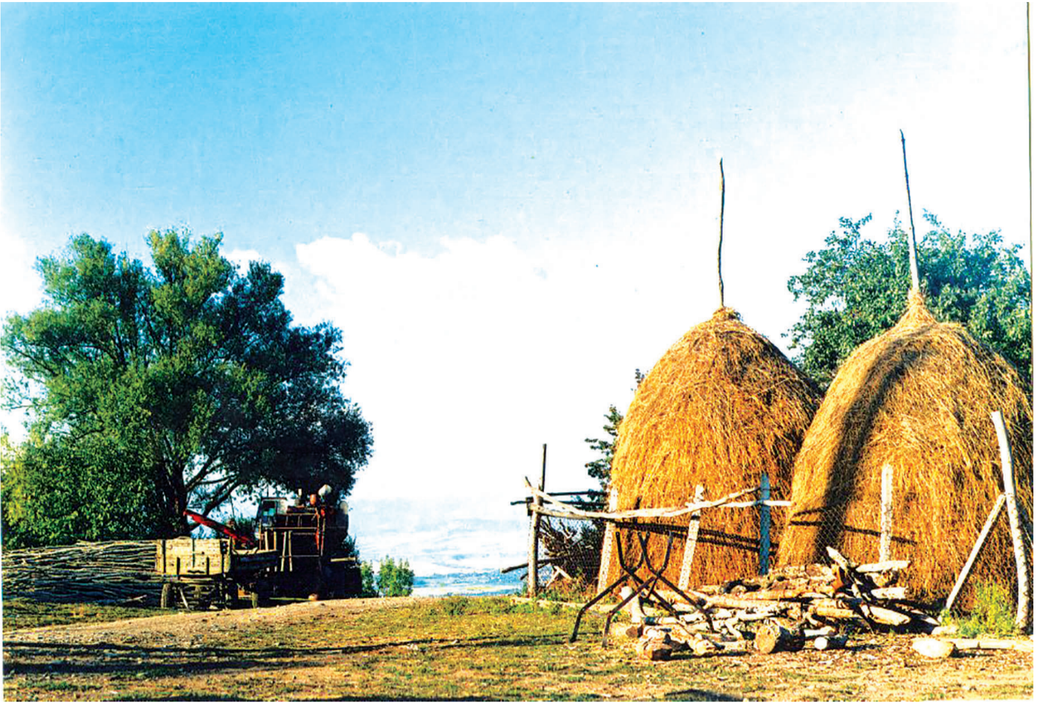
სულ ორი კვირა და ოქროსფერი შემოღობვა შემოგვიღებს კარს. ყელეთი.