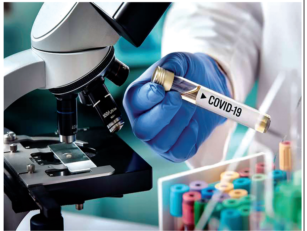
ისმგებლობის გამოვლენისა და ჯანდაცვის სამინისტროს მიერ გაცემული რეკომენდაციების შესრულების მნიშვნელობას ვირუსის მასობრივი გავრცელების პრევენციის საქმეში.

უწყებათაშორისი საბჭოს სხდომაზე კიდევ ერთხელ გაესვა ხაზი მოქალაქეების მხრიდან მაღალი სოციალური პასუხ-