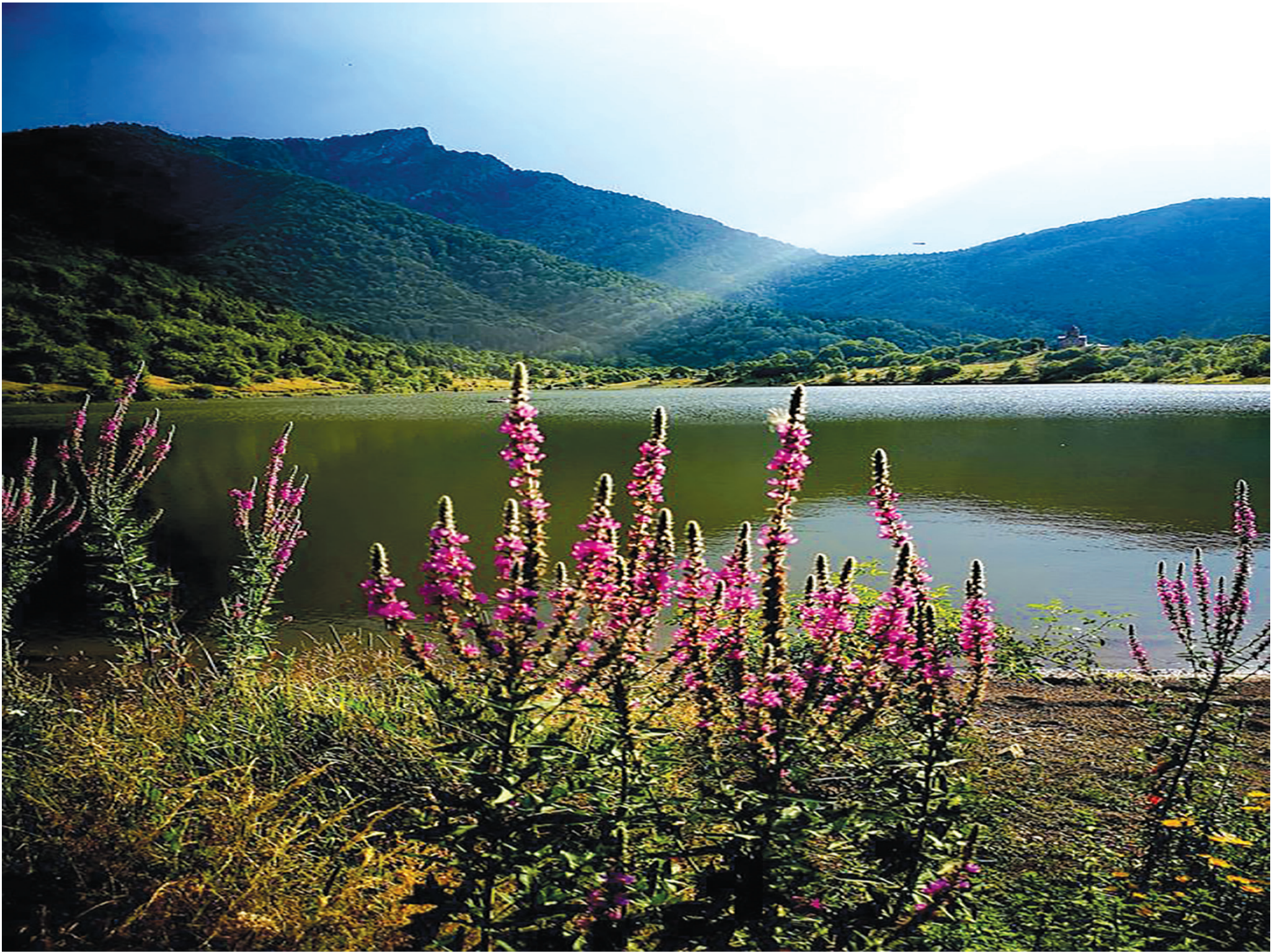
ხაშურის მუნიციპალიტეტის ტურისტული ღირსშესანიშნაობები. კოდისწყაროს ტბა.