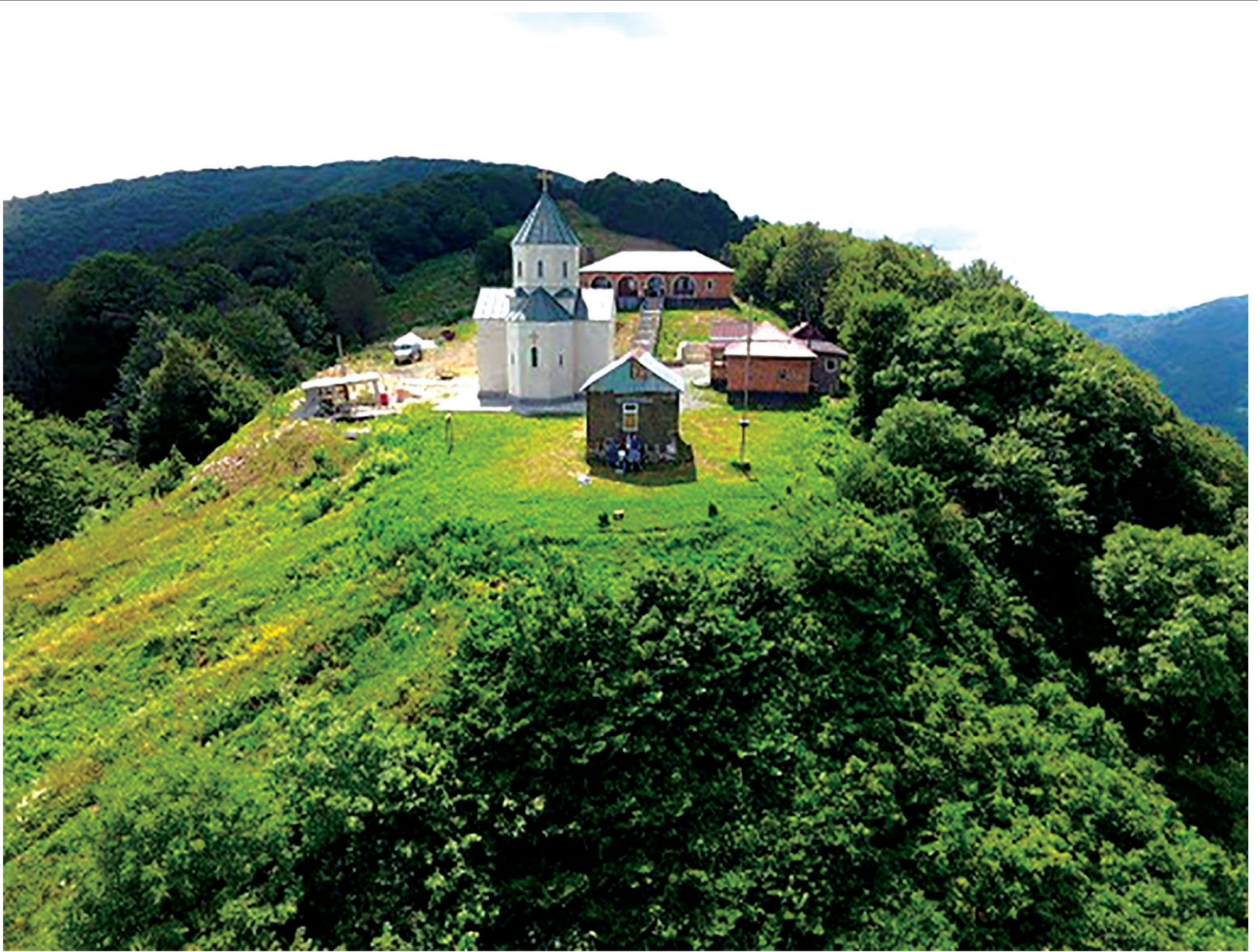
ხაშურის მუნიციპალიტეტის ღირსშესაშინაობანი - ქვიშხეთი - მთაწმინდა.