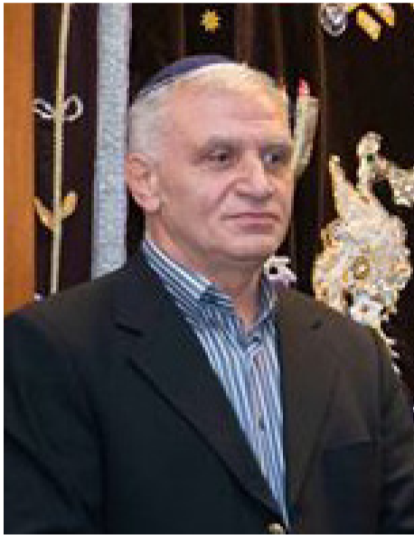
ბააზოვის გამოსვლის შედეგი.

ასეთი იყო ფრანკურტის ყრილობაზე ებრაელი რაბინის დავით