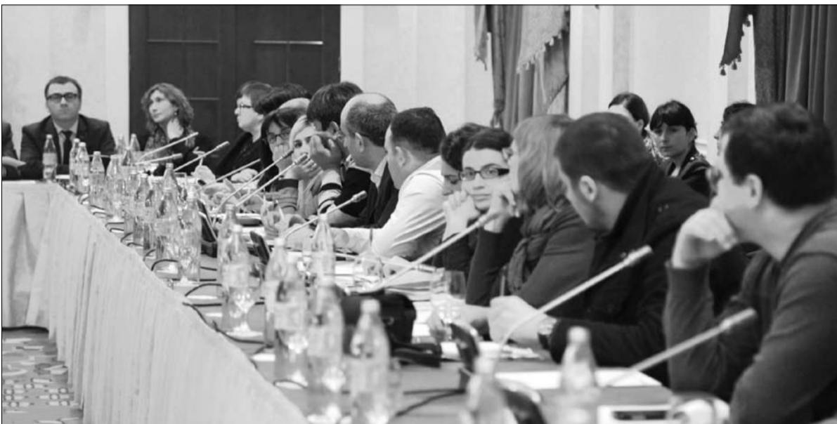
რეგიონული მედიის და არასამთავრობო ორგანიზაციების წარმომადგენლებთან შეხვედრა

ეს გაერთიანება თვითმმართველობის კოდექსის ერთ-ერთი სახელა და მისმა ამოქმედებამ, მუნიციპალურ დონეზე თვითმმართველობის დაკნინება არ უნდა გამოიწვიოს. ასევე, ბუნდოვანია მუნიციპალიტეტების ქონებრივი და ფინანსური საკითხები. ამასთან, მიგვაჩნია, რომ თვითმმარ-