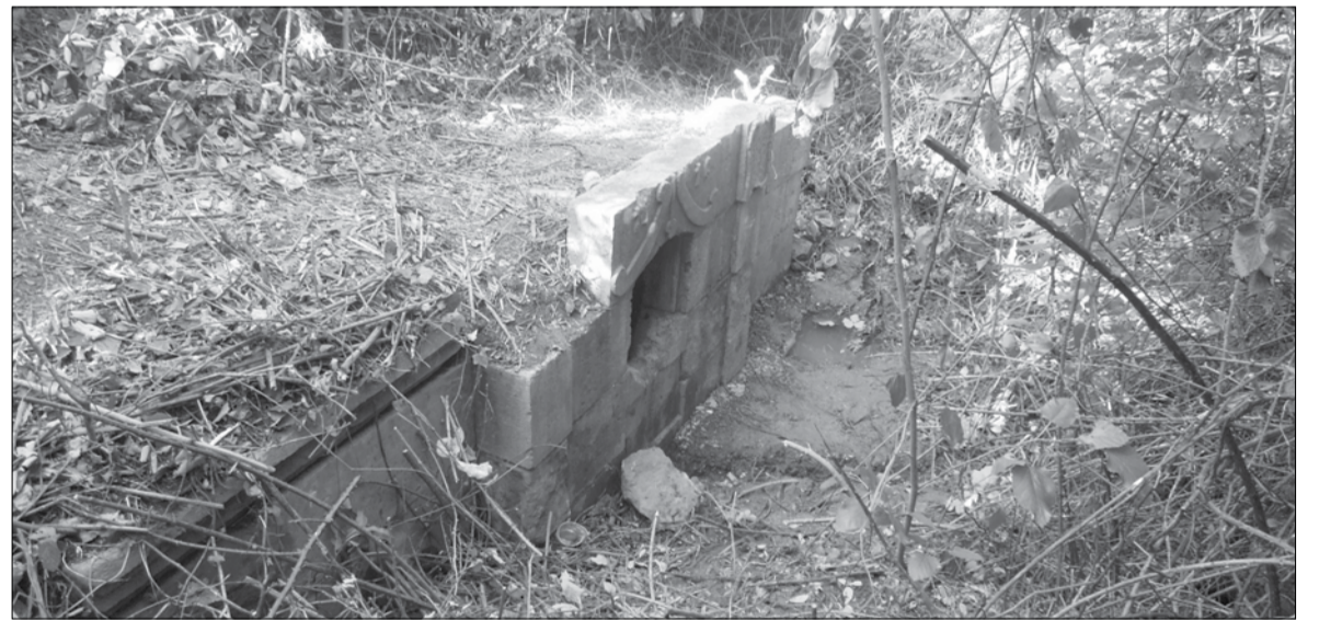
ახა გამოიყურება ღმის „აბაშიძის წყარო“

თითქმის საუკუნეა, ქუთაისში, საფიჩხიის უბანში, მცირე ზომის წყარო არსებობს, რომელიც საზოგადოებისთვის ნაკლებად ცნობილია. წყაროს, რომელიც შეუსწავლელ ძველთა კატეგორიას მიეკუთვნება, წლების წინ საფიჩხიის მოსახლეობა აქტიურად იყენებდა. მაშინ, როცა ქალაქში წყალსადენი არ არსებობდა, წყაროს წყალს საფიჩხიელებისთვის მთავარი საყოფაცხოვრებო დანიშნულება ჰქონდა.