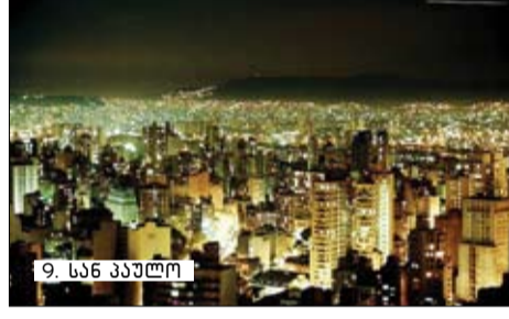
9. სან პაულო