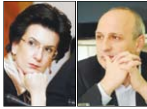
იხილეთ მე-2 გვერდზე

გაკაპასებული ბურჯანაძე მერაბიშვილს სამარის გათხრას ჰპირდება