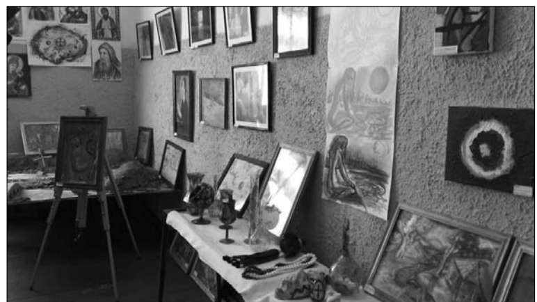
„P.S. ფოტო“ (ნახტამ ჩაბალიშვილი) ©