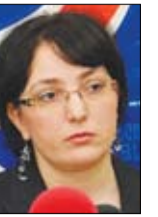
იხილეთ მე-9 გვერდზე

ენცივით გაზეთი „P.S.“-ის განახლებულ საინფორმაციო ინტერნეტპორტალს www.psnews.ge -ს, ყოველდღიურად იკითხეთ ცხელ-ცხელი ამბები და იყავით ინფორმირებული!