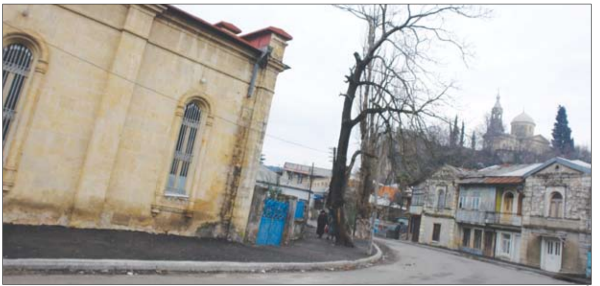
ქუთაისი, ყოფილი შაჰისანი ქუჩა