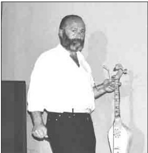
ოი, მონატრება, რატომ უნდა დატყენს ჯერ არგაუშლელი ყაყაჩო?.. ოი, დამბრუნდი, თორემ ეს ტკივილი სადღაც უმოწყალოდ დამახრჩობს...

ოი, მონატრება, ჩემთვის ყველაფერი ისევ უცნაურად ბინდდება, ვისთვის მცირეა და ვისთვის ბუმბერაზი, ღმერთის ნაწუქარი დიდება.