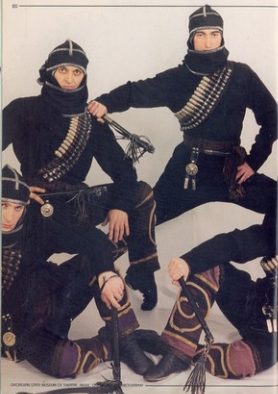
GEORGIAN CIVIL MUSEUM OF TBISSON, 2010