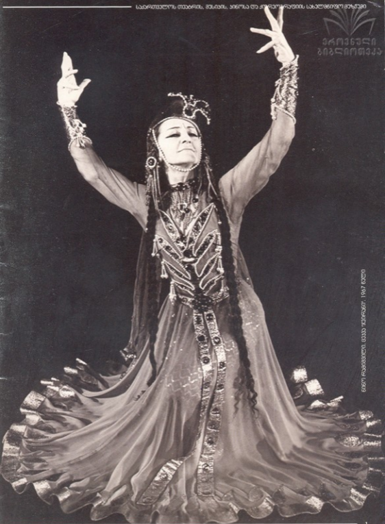
საერთაშორისო მუზეუმის, მუზეუმის, ანტიკური და კონტრკულტურის სახელმწიფო ინსტიტუტი, 1967 წელი