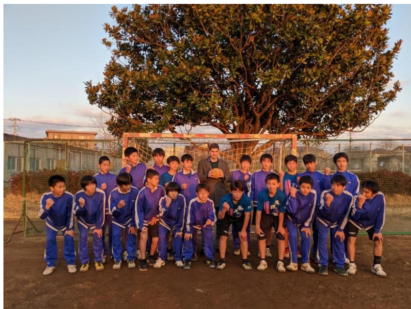
შეხვედრა ტეშიროვის სკოლის ხელბურთელებთან 2019