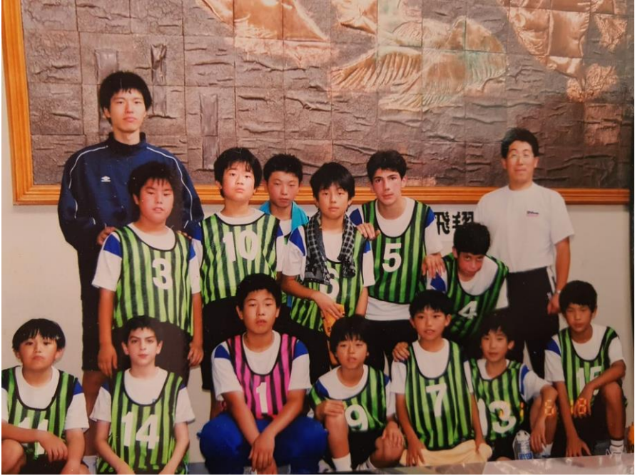
ახლად შეკოწიწებული ტემიროგის გუნდი