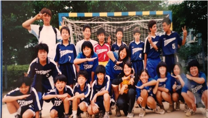
გუნდი ახალ ფორმებში