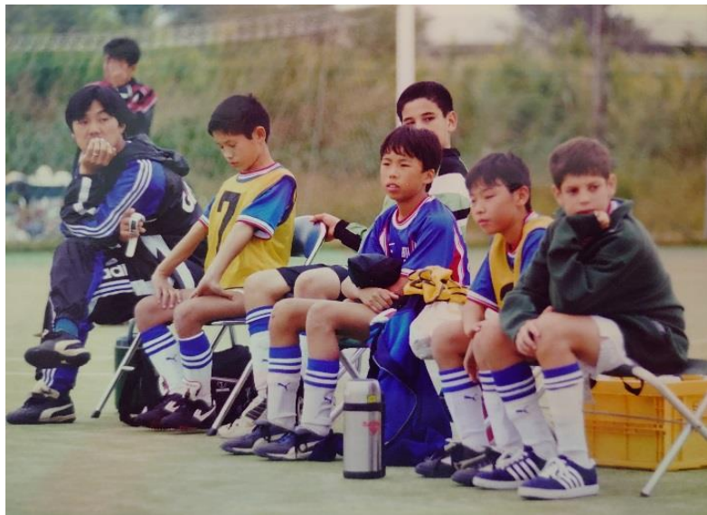
ფეხბურთზე, სათადარიგო სკამზე