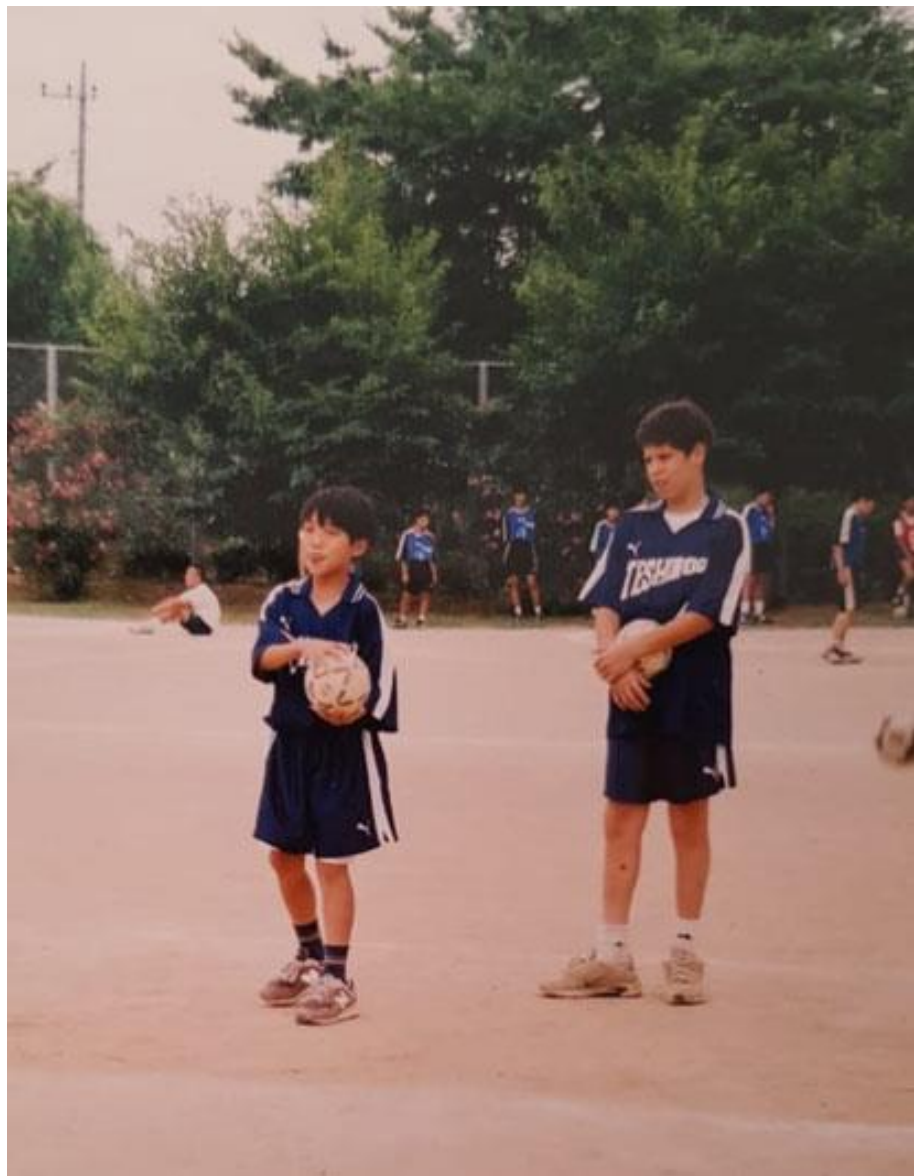
ყოველდღიური ვარჯიშები სკოლაში