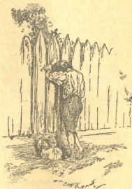
ფაღაზე ლობეზე მიურდნობილი დაღსნს, მწარედ ტაროდა.

რის შეძლებას სიძლიდრე და გავლენა აძლევდა და რასაც სინანულით აღსავსე შეწუხებული გული მოითხოვდა, — როგორმე ენახათ უთავშესაფარო, დატანჯული ბავშვი.