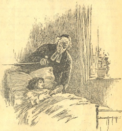
მეც მაქვს თქვენთან ცოტა რამე საკითხი.

— დიახ, მამაო, წყნარად ვიქნები და მოგისმენ; მაგრამ სულ ერთია: მე მხოლოდ ტუანეტას ფილიპე ვარ, და ყოველთვისაც ის ვიქნები.