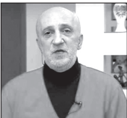
პოლიტოლოგი გია ხუხაშვილი „ახალ თაობასთან“ ინტერვიუში ქვეყანაში გაანვიტარებულ მოვლენებზე საუბრობს.

„როგორც კი პოლიტიკური ციკლი გაიხსნება, სერიოზულ ესკალაციას უნდა ველოდოთ“