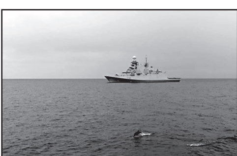
ლია), HMCS FREDERICTON (კანადა), ROS REGINA MARIA (რუმინეთი) და BGS VERNI (ბულგარეთი) და TCG SALIHREIS (თურქეთი).

წვრთნების მიზანია ნავთობ-სა და საქართველოს სანაპირო დაცვის ხომალდების ურთიერთმოქმედებისა და ურთიერთდაცვადობის დონის ამაღლება.