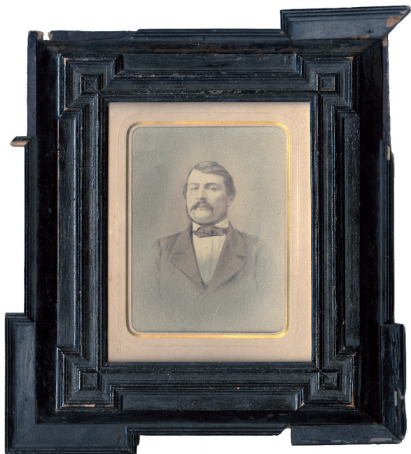
გიორგი ერისთავი 1850-იანი წლები

ბელიანი. მოასწრეს ამ ორს. ჩვენ წინ მეიდანზედ ჩაი- სო კვარტალნიმ დროშკაში. გაქანა ორჯელ კვარტალნი, მოვიდა, მამაშენს კითხულობდა. ის შინ არ იყო. დადიო- და, იქნება, გავიგო რამეო. ცხრა საათზედ შემოვიდა ლამისა. მე უთხარ ჯერ, სამჯერ მოსულა კვარტალნი, კითხულობს. ტანთ იხდიდა, მაშინვე ჩაიცო და წავიდა. მამაჩემა უთხრა, შენ რათ მიდიხარ, თითონ მოგიკით- ხამენ, თუ საქმე აქეთ. მაინც წავალ, გავიგებ. პოლიცია