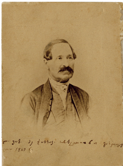
ალექსანდრე ორბელიანი 1850-იანი წლები

მეზიათო. მამაჩემს მაშინვე ეჭვი შეუვიდა, ეს ანბავი ამანაც იცის და ვერ გამოუთქვამს.