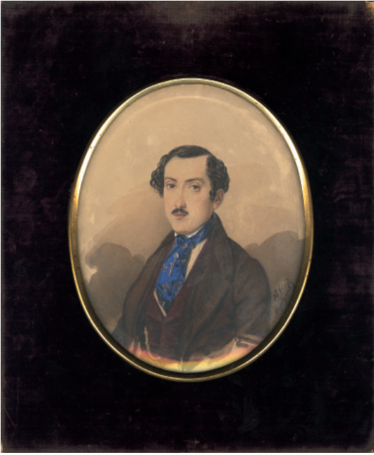
ოქროპირ ბატონიშვილი (ბაგრატიონი) ნახატი ანდრეი მორგუნოვის 1841 წელი

მეგობარი. დაგვამშვიდა ამით. გავიდა ორი კვირა. არა- ფერი ანბავი არა ვიციტ რა. ასე შეშინდა მთავრობა, ორმოცი ცხენოსანი აფხოდი დადიოდა, უვლიდა გარს ქალაქს. ღამეში სამჯერ შემოუვლიდნენ. ვხედამდი მა- მაჩემს საშინელს შენუხებულს. ორი თვე ქვეშაგებიდამ ვეღარ ავდეგ, ისე მოვუძღურდი ტირილისაგან. ჩუმათ ვტიროდი, მამაჩემს კი ვეჩვენებოდი ხოლმე მხიარუ- ლათ, მარამ მატყობდა, რომ ნამტირალევი თვალეზი