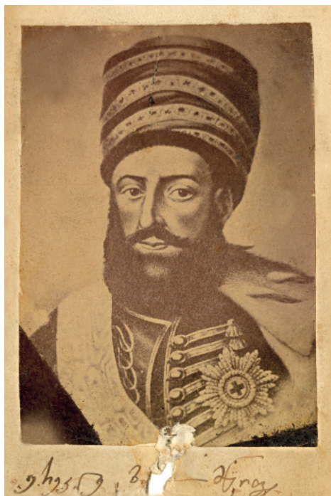
მეფე ერეკლე II

და მოილაპარაკებდა, რისთვისაც იყვნენ მოსულნი. თუ ტყვეები ჰყვანდათ წაყვანილი, იმათს დასხნას ეტყოდნენ. გაურიგდებოდა, მოვიდოდა მეფესთან, მოახსენებდა, ამდენს თუმნათ გაურიგდიო, ფულს წაიღებდა, ტყვეებს მოიყვანდა. ამგვარის თანამდებობის კაცი იყო. იმათ საიდუმლოს შეიტყობდა, საით აპირებდნენ დაცემას, მაშინვე გაამზადებდა იმ მხარეს, რომ არ წამხდარიყო.