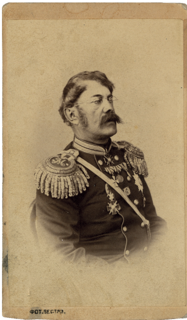
კონსტანტინე მამაცაშვილი 1870-იანი წლები ფოტოგრაფი: ედუარდ ვესტლი

და წავიდა გამოსაცხადებლათ. იქიდან მოვიდა, დაწვა და ხუთი თვე ავანტყოფი შევინახეთ. გამხმარ ტროიკას და წიგნებზედ ხმელათ ჯდომას დაეჩეჩევა სხეული და იმის სიმსივნე და ტეხა ჰქონდა. ერთი მეზობელი მყვან-და ექიმი, იმან უწამლა. გვედგა რკინის ფეჩი იმის ახლო და გაუქრობლათ ვანთებდით. იმდენი წლის სიცოცხლე შეგემატოსთ, რამდენჯერაც მე შეშა დავჭერ და ავანთე ფეჩი, ბევრჯელ რომ ბიჭი არ იქნებოდა.