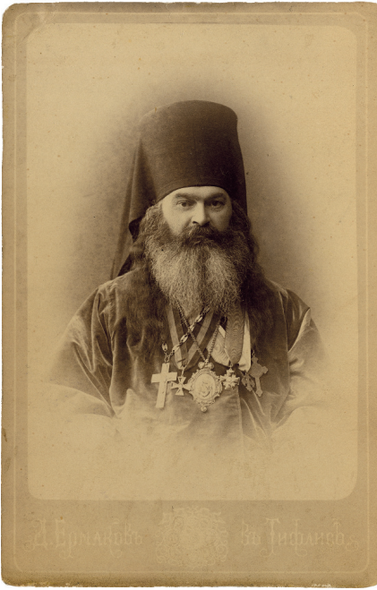
გრიგოლ ეპისკოპოსი ტფილისი, 1880-იანი წლები

მოჰყვენენ ძმა-ბიძები და ერთიც აზნაურშვილის ქალი გასათხოვარი, იმათი ნათლული ყოფილიყო; მეორეს დღეს – დადიანი, ბიძა იყო, ეხლა რომ არქიერია, ორიც ბიძაშვილები ვოენში ემსახურებოდნენ. ახლა დის ნახვა უნდა, რომელიც ინსიტუტში არის. მე უთხარ, წავალ, მოვიყვან, სადამომდინ აქა გვყვანდეს, იმის კლასნი და- მაც მოვა. მე ნაჩაღნიცასთან კარგათ ვიყავ მიღებული და იმედი მქონდა, გამომატანდა. მოვგვარე თავისი და,