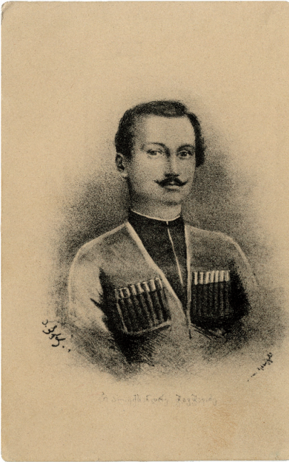
ალექსანდრე ჭავჭავაძე ნახატი ალექსანდრე ბერიძის ლითოგრაფია კონსტანტინე მესხიევის

თაშენაში ბძანდებოდა განესებული, რომელთაც ქრისტიანობა მიაღებინა, ეკლესიაც აუშენებინა და რაც ქართული ჩვეულება იყო მწუხარების, გადიხადეს. ჭავჭავაძენიც ნაბძანდენ კახეთში.