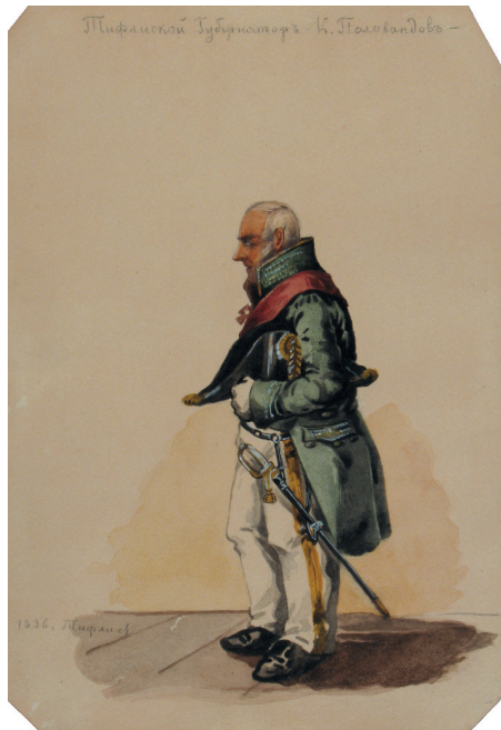
ნიკოლოზ ფალავანდიშვილი ნახატი პლატონ ჩელიშჩევის ტფილისი, 1836 წელი

რომ გამანთავისუფლოს, ჩემი ცოლ-შვილი უკანასკნელს მწუხარებაში არიან ჩემის მოშორებით, აგრეთვე მე ყმანვილმა შევირთე ცოლი და ახლა ეს უბედურება მამივიდა. ნეტავი ცოლ-შვილი არა მყვანდეს, ასე არ ვინუხებდი ჩემი ქვეყნის დაშორებას. ღმერთმა მშვიდობა მისცეს, მიელო ის თხოვნა და ხემწიფისათვისაც შუამავლობა ეთხოვნა, იმის შუამავლობით დაათხოვნა ხემწიფეს. მაშინ ნიკოლოზი მეფობდა. აღდგომის წინას დღეს