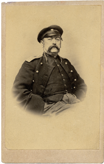
გრიგოლ ორბელიანი 1850-იანი წლები

თი ქალი აიყვანე იმ ვაკანციაში. კარგი, ავიყვან. არა, ეხლავ მოიტანე ქალალდი და ჩანერე, რომ მიიღე იმის ქალი, ისე არ დაგიჯერებ. მოიტანა ქალალდი და ჩანერა, რომ მიიღო. მასუკან ეთქვა ჩემის ბიძისათვის, მისწერე წინოს წიგნი, რომ აიყვანა გრიგოლმა და ნუსნუხარ, მამილოცამს. ეს წიგნი რომ მივიღე, რასაკურველია, დიდათ ვისიამოვნე, ბაბაღესაც ვახარე და შევედი, იოსებს ვაჩვენე ეს წიგნი, წაიკითხე. რომ წაიკითხა, დიდათ გაუკვირდა და ისიამოვნა, ეს როგორ