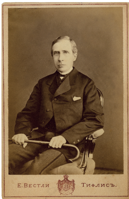
ბარონ ალექსანდრ ნიკოლაი ტფილისი, 1860-იანი წლები

სწუხარ, მოვიკითხამ საქმეს, იმათ ვინა ჰკითხამს, ათი დღეა თუ მეტი, ხვალ მობძანდით და პასუხს მიიღებთ. მე წამოვედი. გაეგზავნა და მოეკითხა საქმე ქრისტიანიჩისათვის, გაეკეთებინა არზა ნამესნიკთან, გრიგოლ ორბელიანოვისათვისაც ხელი მოეწერებინა და ჩემთანაც გამოეგზავნა ხელის მოსაწერათ. თითონ მთავრობა ნამესნიკს და პირათაცა სთხოვა, რომ ბევრი შვილები ჰყავს და შეძლება არა აქვს, რომ შინ გაზარდოს.