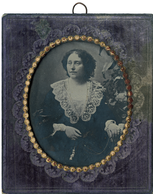
ნინო ჭავჭავაძე-გრიბოდოვა 1854 წლამდე

ის გახლდათ. მამაჩემმა დედაჩემი წაიყვანა სოფელში მეორეს ზაფხულს. მე დავრჩი ქალაქში. დედაჩემი გამხდარიყო ავით. ასე მძიმე ავანტიყოფი იყო, აღარც ფენი ჰქონდა, აღარც ხელი მოძრაობაში. მხოლოდ სმენა და ჭკვა ჰქონდა, ენასაც ვერ იგნებდა, ენაც დაბმული ჰქონდა. მოიყვანეს ქალაქში დედამ და ძმებმა, ძალიან კარგათ მოუარეს, საცა ექიმი გაიგონეს, ყველა მოიყვანეს – რუსი, ქართველი და უცხო ქვეყნისა, ყველას