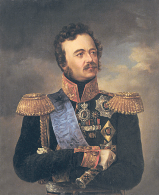
ივან პასკევიჩი უცნობი მხატვარი 1837 წელი

ვალი იყო ხემწიფის ქება. მამიბრუნდა და მითხრა, ეს წიგნი რათა ჰქონდა შენს ქმარს. მეც უთხარი, თითონ ხომ არ შეუთხზავს, რუსებს დაუნერიათ, იმასაც წაუკითხამს. ამის მეტი ვერა უპოვნეს-რა. წავიდნენ, ის ფურცელი წაიღო. ის ღამე გავატარეთ მწუხარებით მე და დედიდამ. ასე გაშიჯეთ, ორი კვირა ბელიოც არ მოუკითხამთ. შემდგომ ბელიოს მოგვიკითხამდნენ ხოლმე.