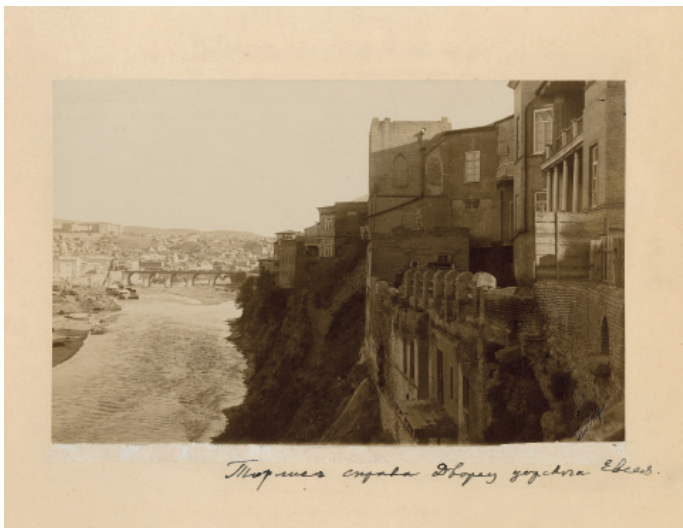
ტფილისი, 1880-იანი წლები

წარმოვადგენდი ჩემს ავანტურას დედას და მოხუცებულს ძალუას, დიდიდედას ამით გავამხიარულებდი, ვაცილებდი. რაც უნდა ქართული ძველებური წიგნი წაეკითხა ანუ ზღაპარი ეთქოთ, ასე დავისწავლიდი, მეორეს დღეს შეუშლელათ ვიტყოდი. დედიდა მყვანდა გასათხოვარი, იმას კი ეჯავრებოდა.