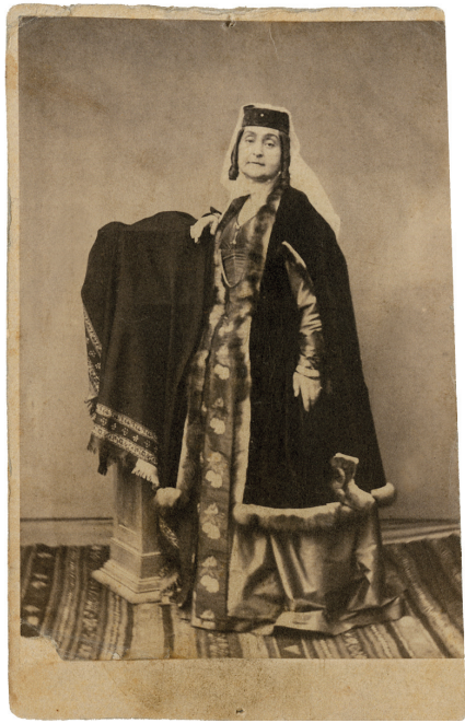
მანანა ერისთავი-ორბელიანი 1860-იანი წლები

ჩვენ პირდაპირ იყო თურმე. იფიქრა, აქ რომ მოვიდნენ დასაჭერათ, ამათ ძალიან შეეშინდებათ, ისევე სჯობს, მე წავალ. წავიდა, მაშინვე წაეყვანათ კაზარმაში.