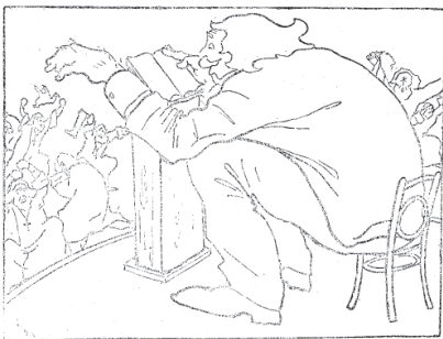
კ. ფოცხვერაშვილი. ვი თქვენდა მწიგნობარო და ფარსეველნო ორგულნო, რამეთუ ცრუმომღერებია თქვენითა აქდუნებთ მრავალთა.