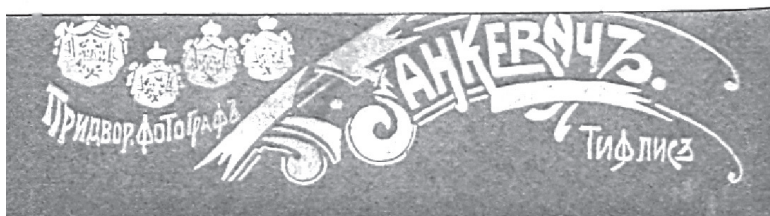
ნიკიტა თალაქვაძე. დიდუბე, 1911