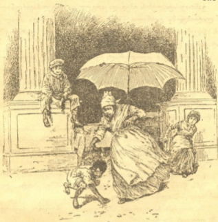
თუ ჩამივარდი ხელში...

ისევ თავის ალაგს დაუბრუნდა. ეს მას არ აკვირვებდა: ამგვარი ქცევა სელინასა და ლილიბელის შორის ჩვეულებრივი მოვლენა იყო.