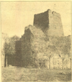
ძველი კოშკი ქართლში