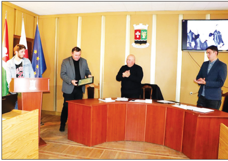
— ჩვენ მაქსიმალურად უნდა დავეჭვიროთ მხარი და დავაფასოთ ყველა იმ სპორტსმენის მიღწევა, რომლებიც ჩვენ მუნიციპალიტეტს, ქვეყნას მსოფლიო მასშტაბით ასახელებენ. ფრაქციის ეს ინიციატივა, რომელსაც

ფრაქცია „ქართული ოცნება“ ახალი ინიციატივით გამოდის, რომელიც შემდგომში წარმატებული სპორტსმენების, ევროპის, მსოფლიო პრიზიორების, ოლიმპიური ჩემპიონებისა და მათი მწვრთნელების მუნიციპალიტეტის მხრიდან ერთჯერადად ფულადი ჯილდოს გადაცემას ეხება. საკრებულოს ფრაქციამ, აღნიშნული ინიციატივით მერიას უკვე მიმართა, შემუშავდება ფულადი ჯილდოს გაცემის წესი, რომელიც სამომავლოდ ბიუჯეტში აისახება.