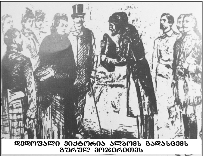
დედოფალი ვიქტორია ალბროს ბადასცემს გურულ მოჯირითთა

მათი ლიდერი იყო პრინცი ივანე მახარაძე. რუსეთში მას დაუკავშირდა აგენტი ერკოლი, რომელმაც ცველანარი საორგანიზაციო საქმეები მოაგვარა მათ ლონდონში ჩამოსაყვანად და ისინი წარმოადგინეს იფენ რეორგ კახაკების პირველი ჯგუფი, რომელმაც რუსეთი დატოვა 1892 წლის 28 მაისს ლონდონური გაზეთი „Pictorial World“ აღნიშნავდა: „ახალი ატრაქციონი ემატება უკვე ისედაც მშვენიერ შოუს ერლ ქორთში, ორმაბათს ჩამოვიდა რამდენიმე დონის კახაკი და ისინი, როგორც ჩვენ გაიფეთ მონაწილეობას მიიღებენ წარმოდგენაში“. ბაფალი ბილის შოუს ვროპაში და კრძიდ ინგლისში კარგად იცნობდნენ. პირველად შოუ 1887 წელს ჩავიდა ლონდონში, დედოფალ ვიქტორიას ოქროს ობიექტზე, სადაც უზარმაზარი წარმატება ხვდა წილად და როგორც ირკვევა, მამნ ეს კახაკები მათთან ერთად არ ყოფილა. (ირაკლი მახარაძე, აკაკი ჩხაიძე, უაილდ უესტის მხედრები“ თბილისი 2001 წელი). გურული მოჯირითები ამერიკის შეერთებულ შტატებში პირველად გამოჩნდნენ 1893 წელს ადამ ფორეასა და ბაფალი ბილის შოუში. გაზეთი „ივერ“ ამის შესახებ 1893 წლის 13 თებერვალს წერდა: „ბათუბი ამს წინად წავიდა აქვამ გურიაში ჩიკაგოს გამოჩენის გამგებელთა სანდო კაცი, რომელსაც დავალებული ჰქონდა, შეკრიბე რამდენიმე ცხენოსანი გურული ვაკაკი და ჩიკაგოს გამოგზავნეო. ამ კაცს