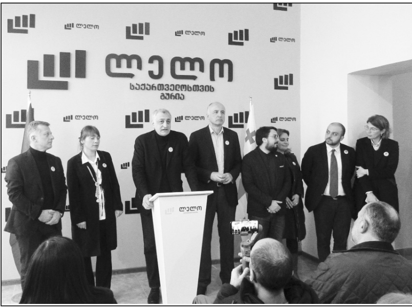
ალიონი. 24 თებერვალს, ქ. ოზურგეთში, პოლიტიკური გაერთიანება „ლელოს“ ოფისი გაიხსნა. როგორც ამ გაერთიანების თავმჯდომარე მაშუკა ხაზარაძე ოფისის პრეზენტაციაზე განაცხადა, ისინი იზრუნებენ სამუშაო ადგილების შექმნაზე, სილატაკის დაძლ-

ევაზე, ქვეყნის ისეთ გზაზე დაყენებაზე, რომ ერთხელ და სამუდამოდ არ გვექონდეს იმის განცდა, რომ ქვეყანა 30 წელია ერთ წრეზე არ ტრიალებს.