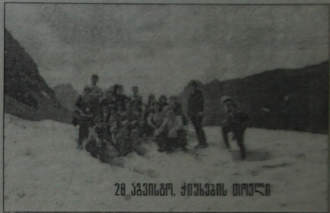
28 აპრილი, ჩიხვიძლის ტოლი

ტარიელ ფუტყარაძე სევსურეთი - საქართველოს ოლიგარქი