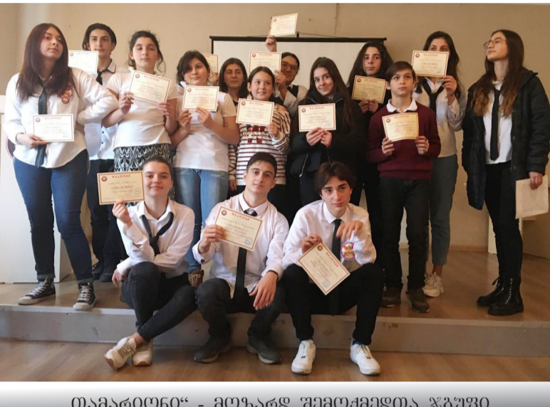
„თამარიონი“ - მოზარდ შემოქმედითა ჯგუფი

დღეს თქვენს წინ ხმას ვიმალე და ვამბობ: -არ აიტანოთ! არც თავი დახართ! და არც არაფერი ჩაყლაპოთ! არც ერთი ადამიანი არ დგას მეორეზე მაღლა. შეიძლება სოციალური და სხვა ფაქტორებით კი, მაგრამ უფლ-