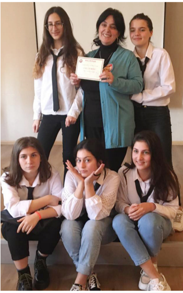
„თამარიონი“ - მოზარდ შემოქმედითა ჯგუფი

სკოლა „თამარიონი“ ნაკლებად უხდებათ მსჯელობა ამ თემაზე, რომელზედაც ახლა უნდა ვისაუბროთ. ეს, დამეთანხმებით, რომ ბედნიერებაა, რადგან დღეს იმ-ვიათია სფერო, სადაც ძალადობის თემა არ იყოს აქტუალური. სამწუხაროდ, ძალიან ხშირია ძალადობის შემთხვევები ოჯახში, სკოლაში, სამსახურში, ქუჩაში... დღეს სიტყვა ძალადობა, ძირითადად შეცვალა ტერმინმა „ბულინგი“. ამ გამოწვევის შემთხვევაში არანაირი მნიშვნელობა არა აქვს ტერმინს. მთავარი ის საშინელებაა, რაც ამ სიტყვის უკან ჩასაფრებულა და ანგრევს ბავშვების, მოზარდებისა და საერთოდ ყველა ასაკის ადამიანის ფსიქიკას.