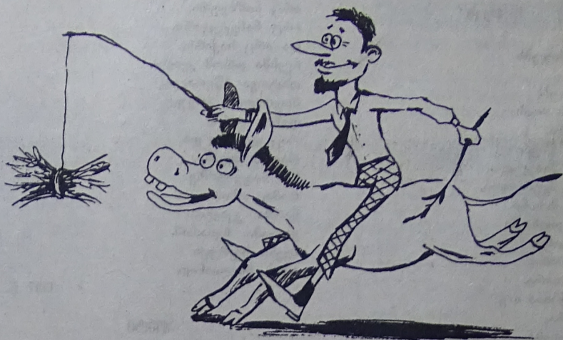
საქართველოს მთავრობა და სავალუტო ფონდი თივისა და ვირის ამპლუაში არიან