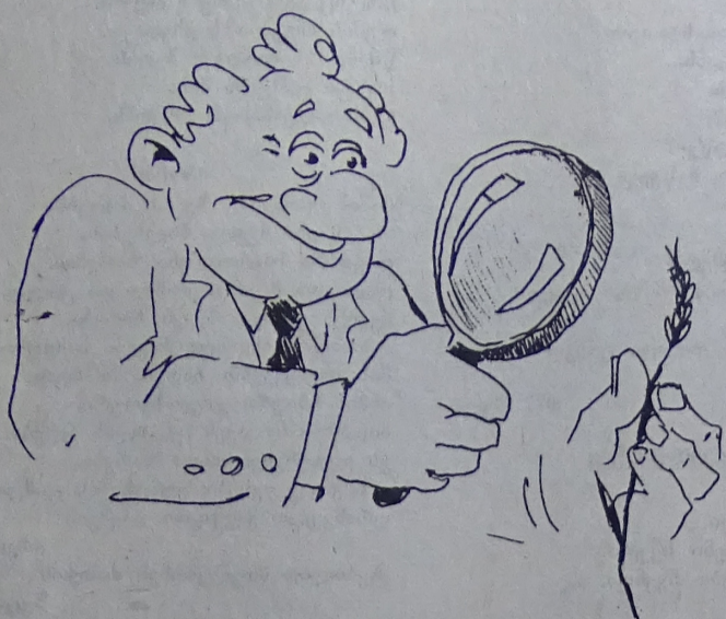
—ოხ, რა მოსავალი გვაქვს! გადავრჩენილვართ, მეგობრებო! ტაში!