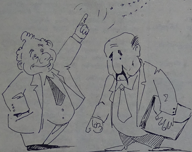
სტატისტიკის სახელმწიფო დეპარტამენტი „ინტერ-პრესი“ „წელს მრეწველობაში წარმოებული პროდუქციის მოცულობა შარშანდელთან შედარებით 10,2%-ით შემცირდა“