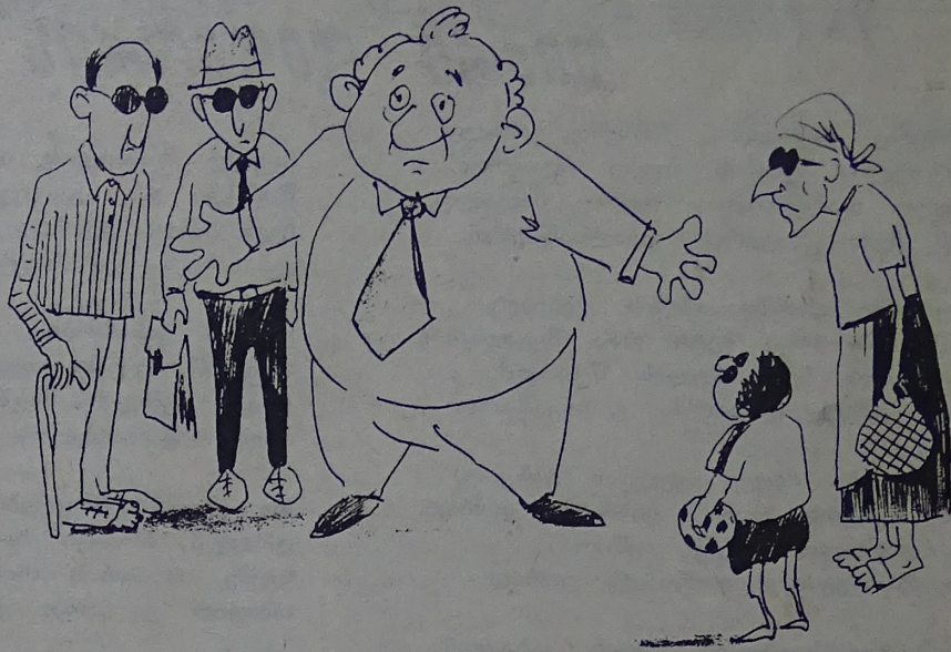
მ. შიშარდნაძე: რამ დაგაბრძავათ ხალხო, ნუთუ ვერ ხედავთ, როგორ აღმავლობას განვიცდით?