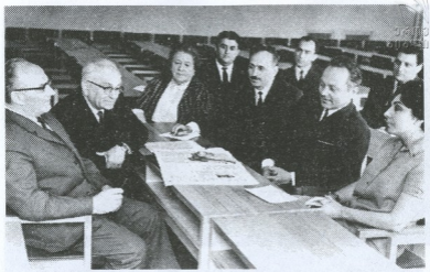
თბილისი სახელმწიფო უნივერსიტეტის სსრკ ისტორიის კათედრა