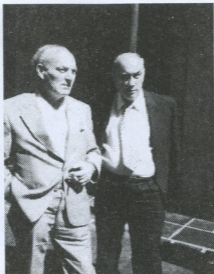
აკაკი სურგულაძე და გიორგი მელიქიშვილი ისტორიკოსთა მსოფლიო კონგრესზე სან-ფრანცისკოში (1975 წ.)