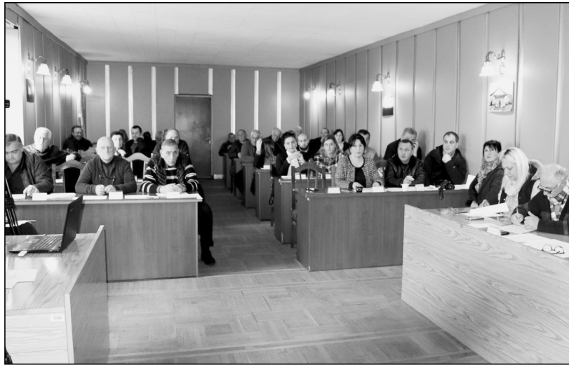
საერთაშორისო ორგანიზაცია "მერსი ქორფისი"-სგან გრანტის მიღებას ეხება, რომლის მეშვეობითაც მუნიციპალიტეტში ქალთა ოთახის ინვენტარით აღჭურვა იგეგმება.

საკრებულომ მხარი დაუჭირა არასამთავრობო ორგანიზაცია „მერსი-ქორფის“-ს და ოზურგეთის მუნიციპალიტეტს შორის გასაფორმებელი ხელშეკრულების შეთანხმების შესახებ“ ოზურგეთის მუნიციპალიტეტის საკრებულოს განკარგულების მიღებას. ხელშეკრულება,